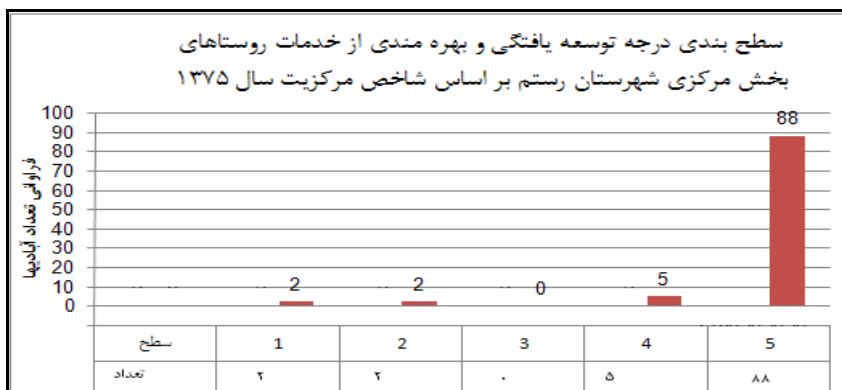
شکل ۲. سطح بندی خدمات در روستاهای بخش مرکزی شهرستان رستم بر اساس مدل شاخص مرکزیت (۱۳۷۵)

بر پایه شاخص سطح بندی، روستاهای بخش در سال ۱۳۸۵ نظم سلسله مراتب تمرکز گرایانه‌ای وجود داشته است. به طوری که در سطوح یک و دو به ترتیب: ۱ و ۲ روستای برخوردار وجود داشته است. در سطح سه همچون دهه قبل هیچ روستایی وجود ندارد و در سطح چهارم ۴ آبادی و در آخرین سطح از طبقه بندی، ۸۳ روستا معادل با ۹۲ درصد از روستاهای مورد مطالعه قرار گرفته‌اند (جدول ۸ و شکل ۳). در این دهه که بعد از تبدیل مصیری به شهر مورد بررسی قرار گرفته نه تنها نظم قبلی از لحاظ برخورداری میان آبادی‌ها تکرار شده است؛ بلکه باز هم اکثریت روستاهای بخش غیربرخوردار و توسعه نیافته قلمداد شده‌اند. این موضوع ناکارآمدی و ضعف در عملکرد خدمات رسانی شهر را می‌رساند.