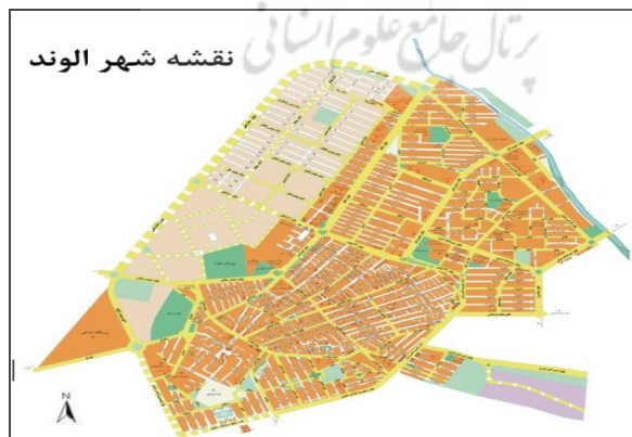
شکل ۲. شهر الوند ۱۳۸۴ (مهندسین مشاور پژوهش و عمران، ۱۳۸۵)