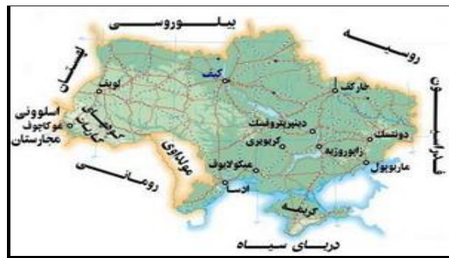
شکل ۳. موقعیت جغرافیایی کشور ایران