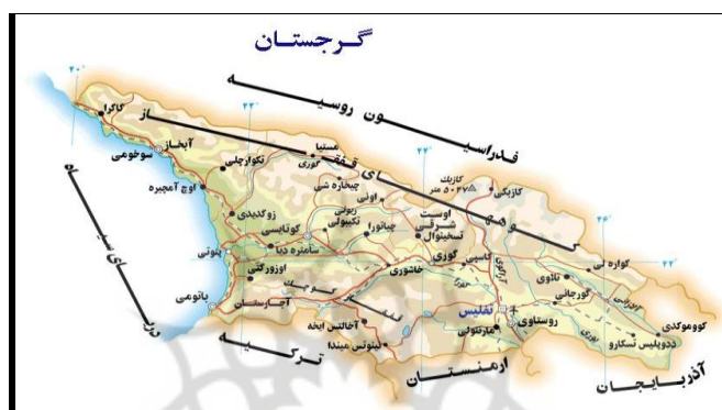
شکل ۲. موقعیت جغرافیایی کشور گرجستان

نزدیکی دولت وقت، به ویژه شخص شوارد نادزه به روسیه، این کشور تن به مصالحه با روسیه داد و پذیرفت که در امور جمهوری‌های خود مختار اوستیای جنوبی و آبخازیا دخالت نکند و با حضور نیروهای روسی در این دو منطقه مخالفتی نداشته باشد. اما پس از انقلاب رز (رنگین/مخملی) در سال ۱۳۸۲ در گرجستان که با پشتیبانی آمریکا صورت گرفت و منجر به برکناری دولت متمایل به روسیه و روی کار آمدن دولت غرب گرای میخایل ساکاشویلی شد، اوضاع سیاسی این کشور دگرگون شد. دولت جدید سیاست دوری از روسیه و نزدیکی به غرب (به ویژه آمریکا) را در پیش گرفت. همچنین این کشور خواهان عضویت در اتحادیه اروپا و ناتو شد. در مرداد ۱۳۸۷ و همزمان با بازی‌های المپیک تابستانی ۲۰۰۸ پکن، ارتش گرجستان برای بازگرداندن اوستیای جنوبی به خاک خود، به این منطقه یورش برد که با واکنش شدید روسیه مواجه شد و مجبور به عقب نشینی شد. اکنون روسیه تنها کشوری است که استقلال دو منطقه آبخازیا و اوستیای جنوبی را به رسمیت شناخته است و با حضور نیروهای خود در این دو منطقه، عملاً کنترل آنها را در دست دارد ( http://www.iraneurasi.ir/fa/pages/clist.php ) (pa=72,1).