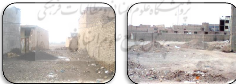
شکل ۲. وضعیت کیفیت مسکن محله از نگاه تصاویر