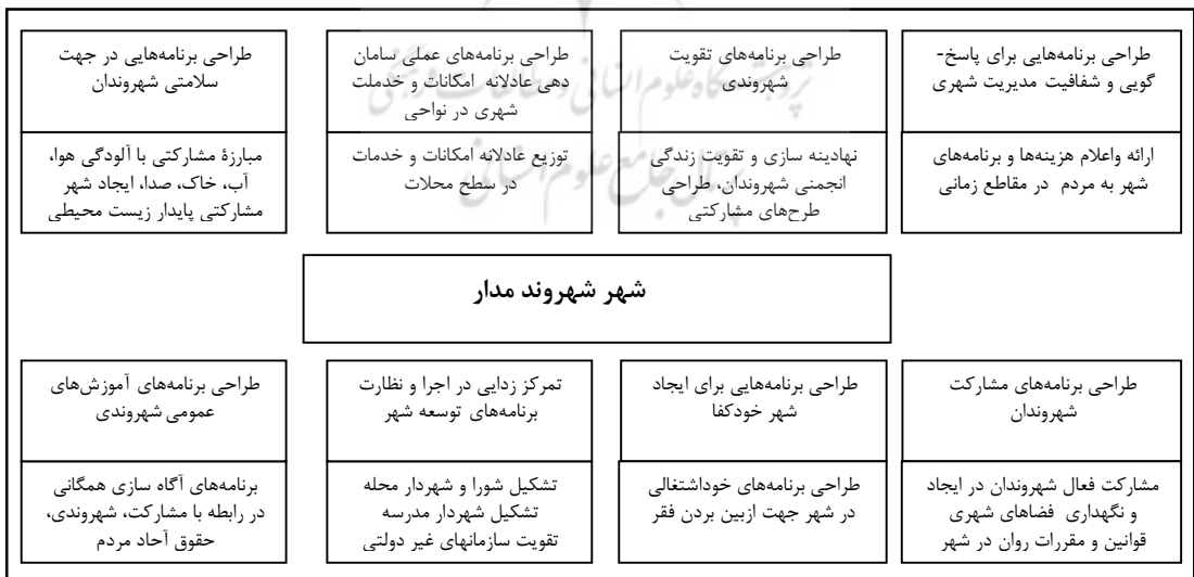
شکل ۱. ملزومات شهر شهروندمدار

انسانی باقی نگذاشته و شهرها تبدیل به فضایی برای کار و خواب، بدون انسجام اجتماعی گردیده‌اند. همه نوع وسایل زندگی در عرصه‌های شهری آماده شده و این درست همپای دور شدن انسان‌ها از یکدیگر است. هر برنامه‌ی عمرانی و هر اقدامی که به گسترش کالبدی یا رفاه شهری می‌انجامد، باید به نحوی عمیق مورد توجه قرار گیرد، تا در این رهگذر جایگاه انسان و ارزش‌های انسانی را ارج نهاده و مرتبت دهد. منظور آن است که مدیریت شهری تشخیص دهد که چیزهایی برای سلامت زندگی در شهرها لازم و چه چیزهایی مضر است. مدیریت شهری، با حفظ اصول باید برای این مسایل به چاره اندیشی بپردازد (نجاتی حسینی، ۱۳۸۰: ۳۸). مهمترین وظیفه مدیریت شهری که با هدف تقویت و بهبود اجتماع محلی کارآمد و مؤثر باید انجام گیرد، شهروند سازی (To build citizenship) است. شهروند سازی یعنی فراهم نمودن امکانات، تسهیلات و ساز و کارهای لازم برای شهروندان تا آنها از حقوق شهروندی شان بهره مند شوند و ضمناً بتوانند به نحوی مناسب وظایف و تکالیف شهروندی شان را در قبال جامعه محلی و شهری که در آن زندگی می‌کنند انجام دهند. تحقق عدالت اجتماعی در سطح محلی و شهری از وظایف مدیریت شهری است (Demaine, OP.Cit: 163-178). روبرط مناسب شهروندی و مدیریت شهری باعث بسط توانایی‌های شهروندان، تقویت حس تعلق اجتماعی شهروندان به شهر، تقویت حس اعتماد اجتماعی شهروندان به نظام مدیریت شهری و نیز حل مشکلات شهری از طریق مشارکت شهروندان و مدیریت شهری می‌شود (نجاتی حسینی، ۱۳۸۰: ۴۱).