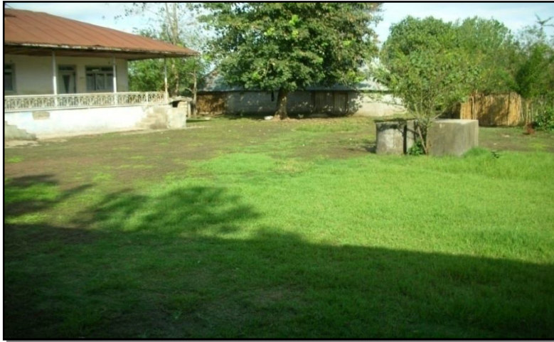
شکل ۵. نمایی از عدم استفاده مطلوب از فضاهای خالی داخل بافت دایر روستا