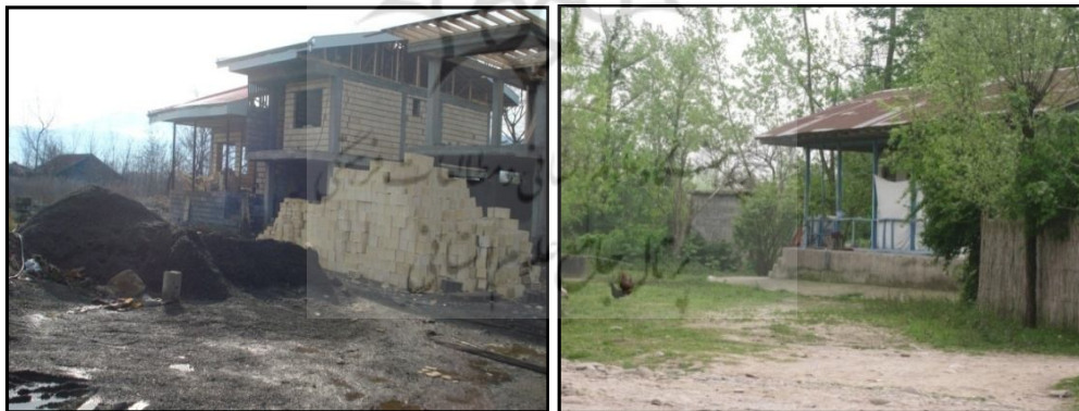
شکل ۳. اختصاص مساحت زیاد به کاربری مسکونی در روستاهای جلگه‌ای