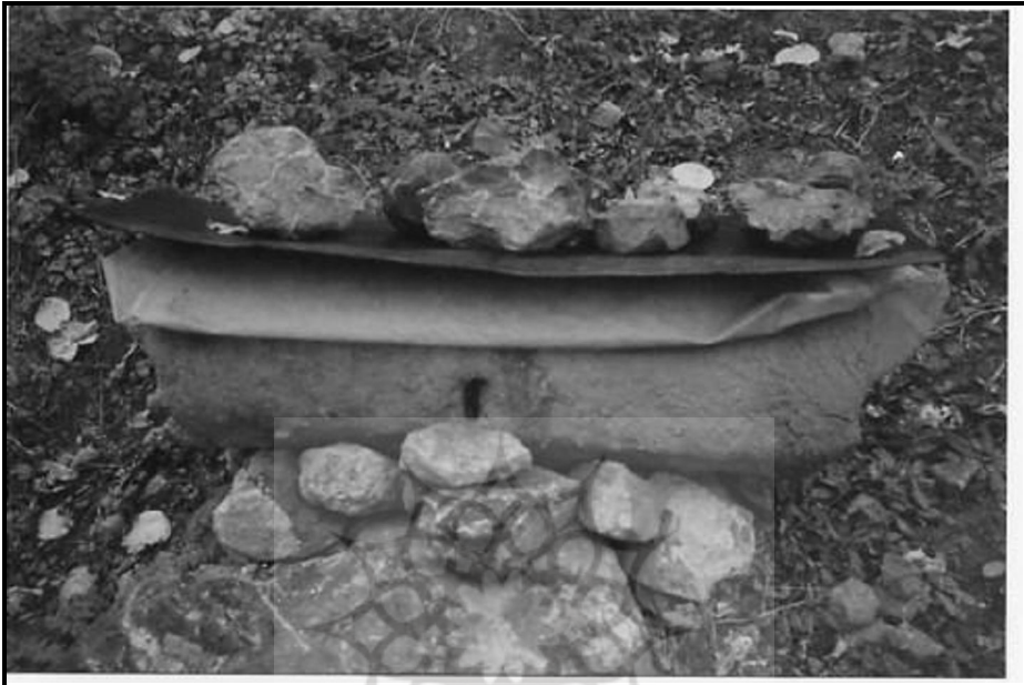
شکل ۱. کندوی زنبورعسل با مخزن کلی (تکنیک ایران باستان) در روستای یازن در ارتفاع ۲۳۵۰ متری واقع در اطراف قله سماموس رودسر

قلعه رودخان، ماسوله قدیم و ماسوله جدید، امامزاده ابراهیم(ع)، امامزاده اسحاق(ع)، اسپیلی؛ دیلمان، سفیدآب رحیم آباد وجواهردشت و ... را نام برد (شکل ۱).