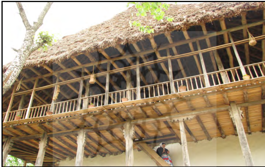
تصویر ۶: معماری سنتی مسکن روستایی شهرستان لنگرود

فراهم آورده است. کشاورزی این ناحیه علاوه بر جنبه‌های اقتصادی که برای گذران معیشت جوامع انسانی مهم می‌باشد، همراه خود بار فرهنگی - اجتماعی فراوانی دارد که طی سالیان دراز نسل به نسل در زندگی مردمان ناحیه آمیختگی پیچیده‌ای دارد. اکنون که متنوع‌سازی فعالیت‌های کشاورزی در اکثر کشورهای پیشتاز صنعت توریسم به سرعت رو به جلو می‌تازد و رواج شاخه‌ی جدید گردشگری با عنوان گردشگری کشاورزی سهم عمده‌ای در درآمد روستاییان دارد، زمان آن فرا رسیده است که در کشور ما هرکجا که امکان سرمایه‌گذاری در این زمینه وجود دارد به مرحله اجرا گذاشته شود و طبق بررسی‌های صورت گرفته، شهرستان لنگرود از شرایط مناسبی در این زمینه برخوردار می‌باشد و می‌توان همراه با عرصه‌ی جهانی در این زمینه‌ی گام‌های موثری برداشت. تصویر (۶). شکل (۲) نقشه‌ی انواع گونه‌های گردشگری روستایی شهرستان لنگرود را نشان می‌دهد.