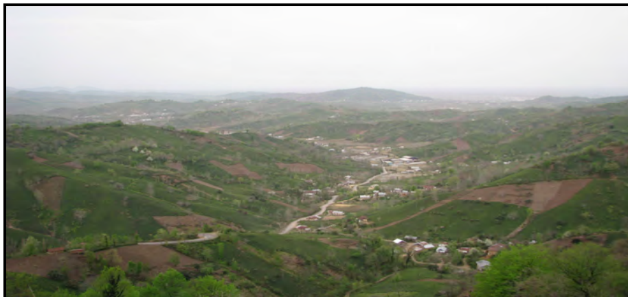
تصویر ۴: چشم اندازی از باغات چای در پیرامون روستایی در دهستان دیوشل