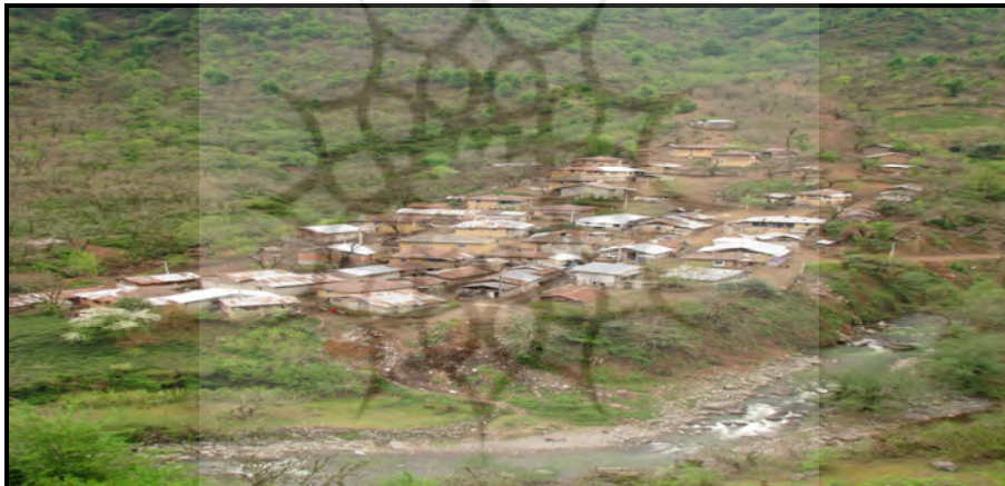
تصویر ۲: یکی از روستاهای جنگلی در حاشیه رودخانه در دهستان لاتلیل

در ضمن از آنجایی که برخی روستاهای محدوده که اقتصاد آنها متکی به دام بوده و شامل طرح خروج دام از جنگل شده‌اند، این خدمات رسانی را بیشتر با مشکل مواجه ساخته است که به طور کلی یکی از راه‌های آن توسعه گردشگری در محدوده برای کاهش آسیب رسانی به جنگل و بهبود وضعیت خدمات رسانی را ایجاد می‌کند ضمن اینکه می‌تواند علاوه بر بهره‌وری بهتر از امکانات محیطی منطقه از مهاجرت و سردرگمی روستاییان در نقاط شهری جلوگیری به عمل آورد. تصاویر (۳ و ۲).