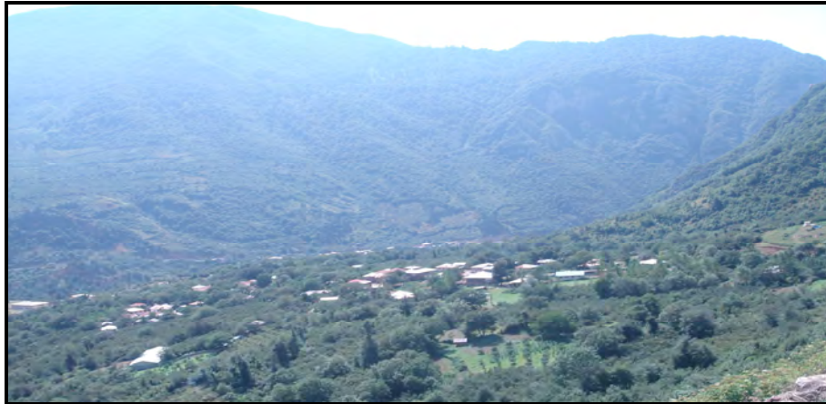
تصویر ۳: نمایی از روستاهای جنگلی در جنوب شهرستان لنگرود