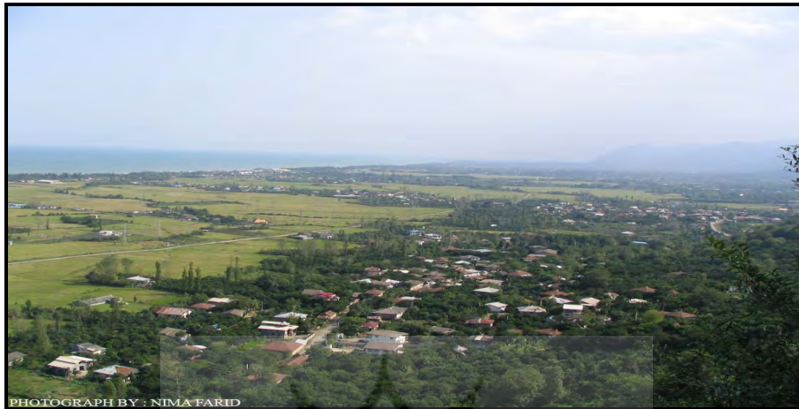
تصویر ۱: چشم اندازی زیبا از روستاهای ساحلی شهرستان لنگرود

ی بخش ها از مزایای گردشگری بهره مند می شوند. این نوع از گردشگری مهمترین اثرات محیطی که در حاشیه دریا داشته، شامل ویلاسازیهایی است که در ساحل صورت گرفته و یک نوار خانه های دوم را در کنار دریا ایجاد کرده است به طوریکه بافت کاملاً متفاوت و متمایزی نسبت به فضای روستا دارد، اگرچه در فاصله حداکثر ۲۰۰ متری از آن واقع شده است. تصویر(۱).