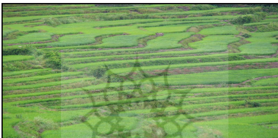
تصویر ۵: نمایی زیبا از شالیزار در حاشیه‌ی جاده‌ی ارتباطی در روستا