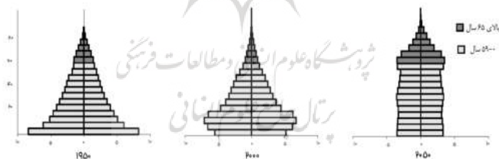
نمودار ۲: هرم سنی جمعیت ایران در سال‌های مختلف (هر واحد ۵ میلیون نفر) ۲

مورد توجه قرار داد؛ اول اینکه میزان رشد جمعیت، در آینده بسیار نزدیک مجدداً در نتیجه تشکیل خانواده متولدین دوره شوک جمعیتی، افزایش خواهد یافت. ثانیاً هرم سنی جمعیت ایران در آینده نزدیک به سمت پیر شدن جمعیت حرکت خواهد نمود؛ که هر دو موضوع به شدت هزینه‌های بهداشتی و درمانی را تحت تأثیر قرار خواهد داد. چرا که تعداد نوزادان و کودکان و نیز افراد مسن در ساختار جمعیتی ایران افزایش خواهد یافت. با در نظر گرفتن این نکته باید عنوان نمود که رشد هزینه‌های سلامت در طول سال‌های اخیر، علیرغم سهم بالای جمعیت جوان در کشور، کمی نگران کننده به نظر می‌رسد. بنابراین با توجه به عدم جهش در درآمد سرانه (بدون نفت) کشور در طول ۳ دهه اخیر، رشد سهم هزینه‌های سلامت در تولید ناخالص داخلی کشور را نمی‌توان مستقیماً در نتیجه تحول ساختار اقتصاد کشور قلمداد نمود. به‌علاوه توجه به هرم سنی جمعیت کشور نشان می‌دهد که رشد سهم هزینه‌های سلامت در اقتصاد در حالی رخ داده است که بخش عمده‌ای از جمعیت کشور در سال‌های مورد نظر در دوران جوانی خود بوده‌اند. با توجه به پایین بودن تقاضا برای مراقبت‌های بهداشتی و درمانی در این سنین، نمی‌توان رشد هزینه‌های سلامت را ناشی از تغییرات جمعیتی به شمار آورد. با توجه به این دو موضوع، شناسایی عوامل مؤثر در این افزایش می‌تواند مسیر را برای کنترل افزایش حتمی هزینه‌های سلامت در آینده هموارتر نماید. برای این منظور روش‌ها و ابزارهای مختلفی را می‌توان مورد استفاده قرار داد؛ اما در مطالعه حاضر سعی شده است به این موضوع از منظر رشد نامتوازن اقتصاد توجه نموده و از مبانی نظری مربوط به «بیماری هزینه‌ای بامول» ۱ استفاده شود.