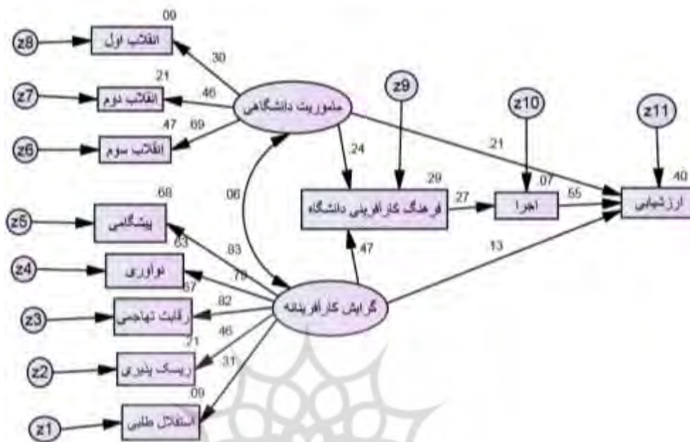
شکل ۲: مدل ساختاری پژوهش در حالت بنای استاندارد

در جدول زیر شاخص‌های برازش مدل ارائه شده است: