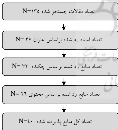
شکل ۲- جستجو و انتخاب مقالات مناسب

جستجوی ادبیات: بیش از ۱۳۵ سند علمی و مطالعه منتشر شده در پایگاه‌های اطلاعاتی علمی معتبر داخلی در سال‌های ۱۳۸۷ تا ۱۳۹۹، براساس کلید واژه‌های (فرهنگ ۳ ، سیاست‌گذاری فرهنگی ۴ ، آموزش عالی ۵ ) و ارجاعات مرتبط در زمینه دانشگاه‌ها و موسسات آموزش عالی مورد جستجو قرار گرفتند.