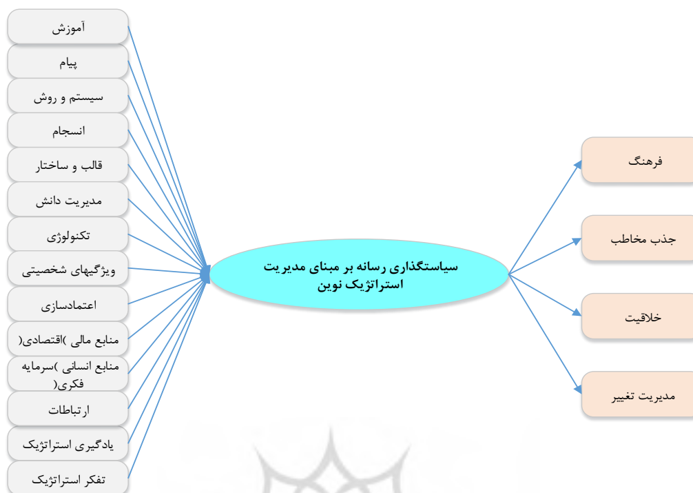
شکل ۱- مدل عوامل شناسایی شده حاصل از بخش کیفی

مدل مفهومی پژوهش توسط ۷۰ گویه اندازه‌گیری می‌شود. مدل را که رابطه متغیر با سؤالاتش را نشان می‌دهد و در واقع همان تحلیل عاملی تأییدی است در