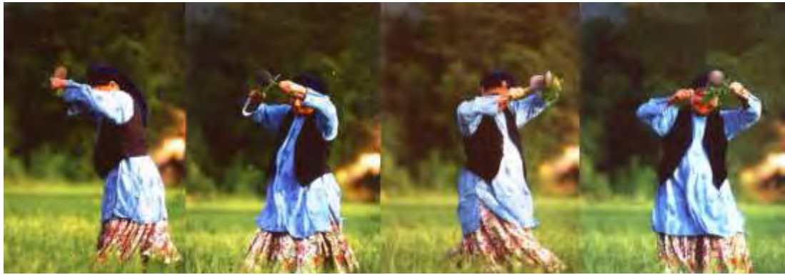
«کترا رقص» گیلان، تالش