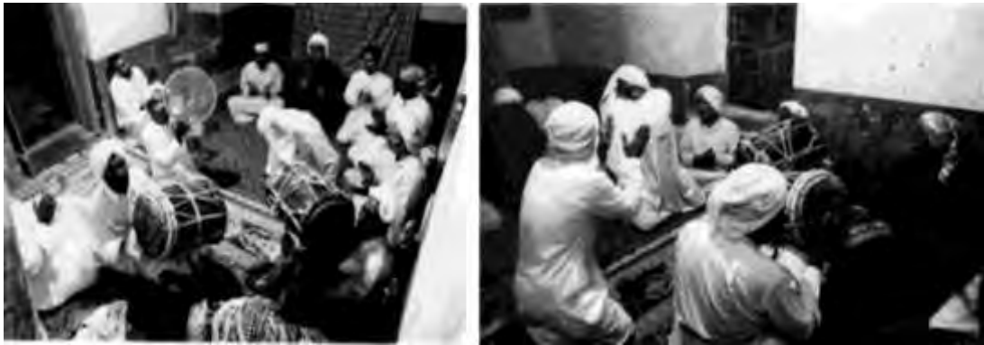
«مراسم زار» روستای سلخ در جزیره‌ی قشم، ۱۳۸۳