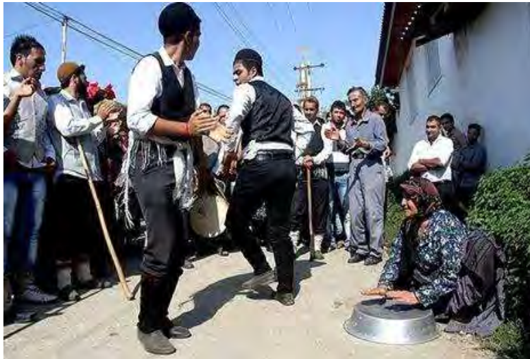
«رقص لاک سری سیما» مازندران