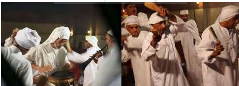
«مراسم لیوا» برگرفته از مراسم اجرا شده در حوزه‌ی هنری استان هرمزگان، ۱۳۹۰

در واقع از میان مجموعه‌ی بادهای «لیوا» از سبک‌ترین و کم‌خطرترین آن‌ها است (نصری اشرفی، ۱۳۷۹:۳۷) و به‌عنوان تفریحی عمومی مورد توجه قرار دارد. تقریباً همه‌ی معتقدان به این‌گونه آیین‌ها علاقه‌مندند تا به‌صورت داوطلبانه، در مراسم آن شرکت کرده و به رقص و بازی بپردازند. «لیوا» در بلوچستان بر دو قسم می‌باشد: