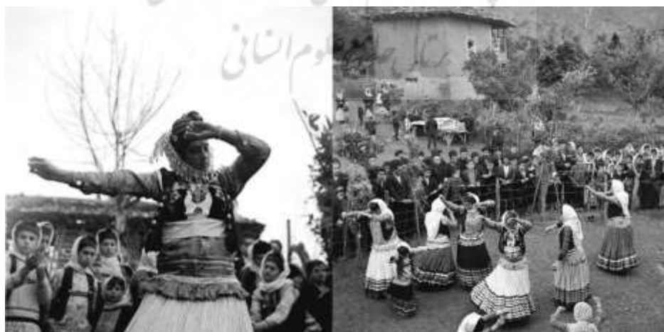
«رقص قاسم‌آبادی» گیلان

رقص رایج زنان این منطقه «قاسم‌آبادی» است. رقصنده دو لیوان یا استکان را با هر دست خود برداشته که در اصطلاح به آن «دس سنج» گفته می‌شود.