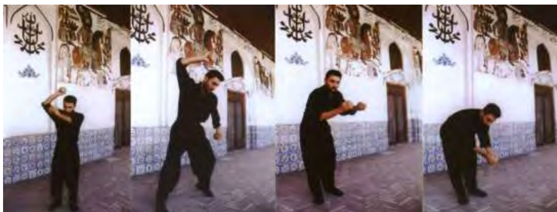
شکل ۲: «کرب زنی» گیلان، لاهیجان