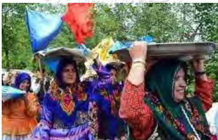
«رقص با مجمه» گیلان

این رقص با نواختن تشت همراهی می‌شده و گاه با آهنگ‌های لاره لاره، داجینیم یار یار... نیز در فصل بهار و روزهای نوروز خوانده می‌شده است. (درویشی، ۱۳۸۰: ۱۹۰) در غرب مازندران (تنکابن، رامسر و...) به این مراسم «پشت لاک کوتون» (پشت تشت کوبون) می‌گویند. (درویشی، ۱۳۸۴: ۵۵۱)