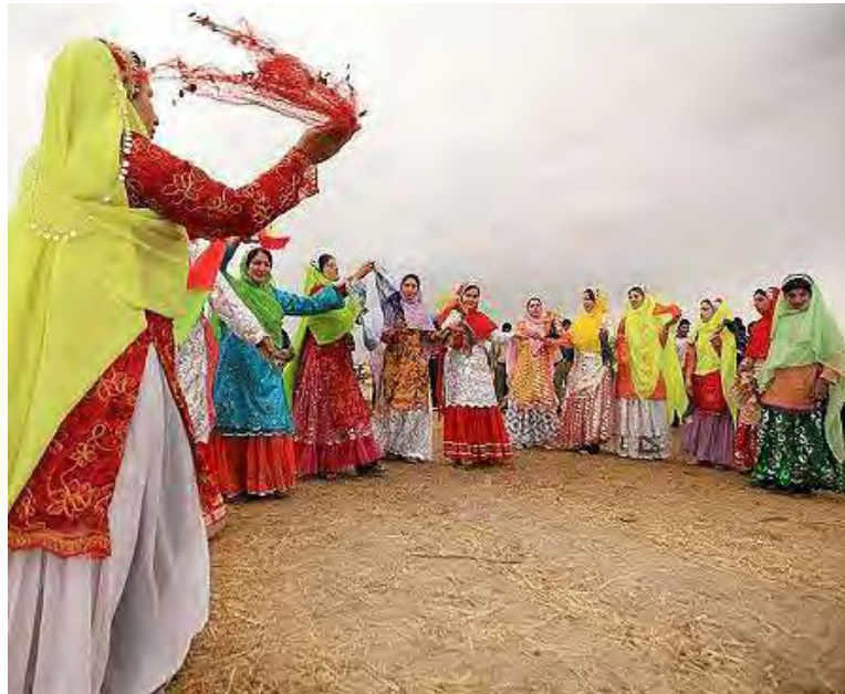
«رقص زنان قشقایی»