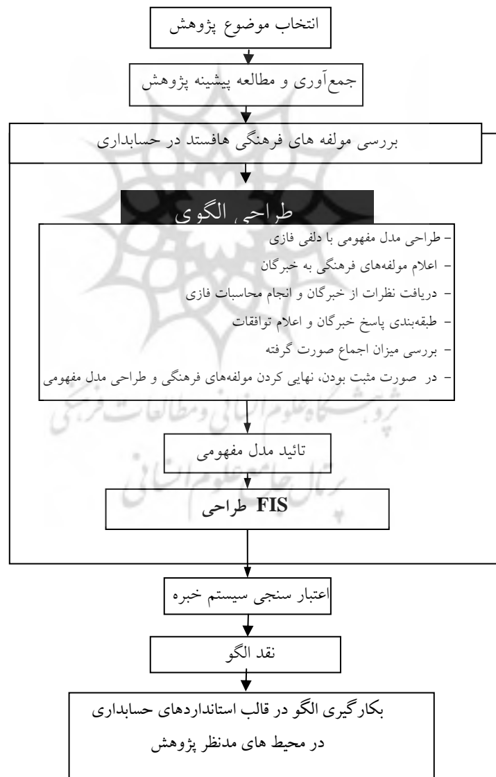
شکل ۲: مراحل ارزیابی الگوی ارزیابی مولفه های فرهنگی در استانداردهای حسابداری

از این رو، با انجام مطالعات گسترده و مستمر به شناسایی، تعریف و تعیین مصادیقی از هر یک از