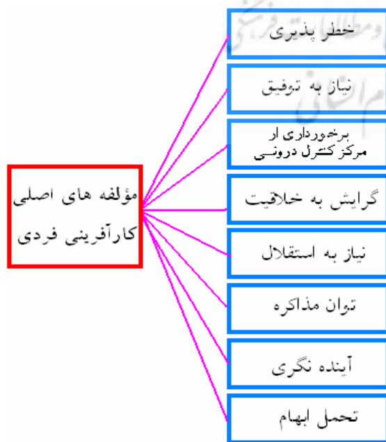
شکل (۲): مدل مفهومی پژوهش

که والدینش شغل آزاد دارند و برای خود کار می‌کنند، بیش از افرادی که شغل والدینشان دولتی است، علاقه دارند تا برای خود کسب و کاری ایجاد کنند. پس اگر چند تن از اطرافیان به نوعی کار آفرین باشند، احتمال خیلی زیادی دارد که فرد نیز به سوی فعالیت‌های کار آفرینانه سوق پیدا کند. (اینار ۲۰۰۵، ۲۰)