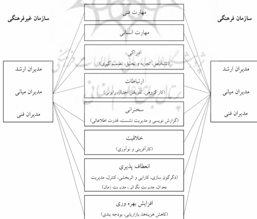
نمودار (۱): مدل تحلیلی پژوهش

پی‌ریزی عملکرد صحیح اعتماد شود. «دراکر» خیلی ساده در این خصوص بیان می‌دارد: «برای فهمیدن اینکه چگونه تولید، کیفیت و قابلیت ارائه را ارتقاء بخشیم از کسانی که این کارها را انجام می‌دهند بپرسیم.» (۵) سرانجام اینکه برای تضمین استمرار دانش و آگاهی، مردم در همه سطوح نیازمند آموزش و فراگیری هستند. «دراکر» می‌گوید: بزرگترین و بیشتری سود حاصله از آموزش تنها فراگیری چیزهای جدید نیست، بلکه انجام بهتر امور است که قبلاً خوب انجام می‌شده و به همین اندازه مهم که شاغلین در بخش دانش‌افزایی و خدمات به هنگام تدریس و آموزش از دانش و آگاهی افزون تری برخوردار می‌شوند. (cook,1997 79)