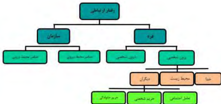
شکل (۱) رفتار ارتباط اخلاقی