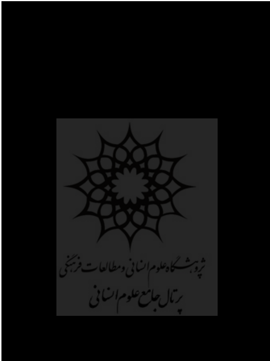
شکل ۱: نتایج تحلیل عامل تأییدی پرسش‌نامه‌ی چهار عاملی نگرش نسبت به اینترنت

روی عامل سوم دارای بیشترین بار عاملی و معنی‌دار و سؤالات خرده مقیاس مفید بودن اینترنت، روی عامل چهارم دارای بیشترین بار عاملی و معنی‌دار بودند که