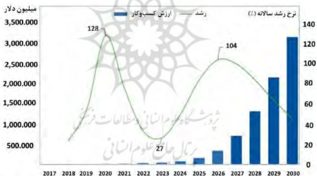
شکل ۱: ارزش بازار و نرخ رشد سرمایه گذاری در حوزه بلاکچین (منبع: Blockchain Business Value, (Worldwide, 2017-2030, Gartner ۳ )