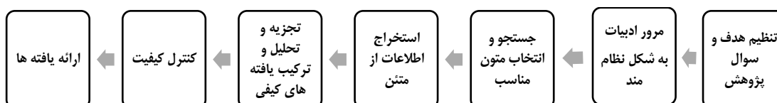
شکل ۱. مراحل هفت‌گانه

در این پژوهش از روش هفت مرحله‌ای فراترکیب سندلوسکی و باروسو استفاده می‌شود.