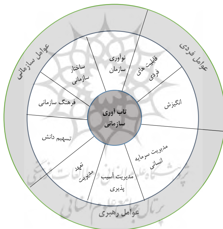
شکل ۲. مدل نهایی پژوهش

قابلیت سازمانی برای بقا، سازگاری، بازگشت به شرایط مطلوب و برای رویدادهای غیرمنتظره، گاهی اوقات فاجعه‌بار و به معنای وسیع‌تر، محیط‌های آشفته به کار گرفته شود. این قابلیت در سطوح مختلف از سطوح فردی تا گروهی و سازمانی تکامل می‌یابد و در سطوح مختلف و توسعه مستمر از ادراک و رفتار کارکنان تا ساختار و شبکه زمینه‌ای و استراتژی‌ها و مباحث مدیریتی است. با توجه به موارد فوق و ارتباط بین فرضیه‌های تأیید شده، می‌توان مدل تاب‌آوری را بر اساس شکل شماره ۲ و ارتباط بین شاخص‌ها را بر اساس شکل شماره ۲ مشاهده نمود.