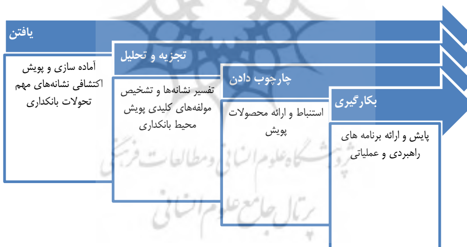
شکل ۲. فرآیندهای پویای محیطی در بانک‌ها