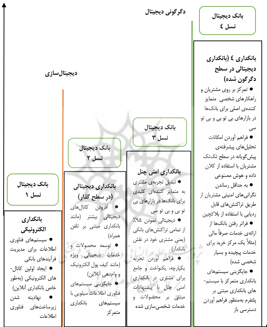
شکل ۲- روند تحولات و تکامل بانکداری دیجیتال

نوبنی همچون روباتیک، بلاکچین و غیره تأثیرات بسیار زیادی را در صنعت بانکداری داشته و دارد (گوهری فر، خاشعی و دهدشتی، ۱۴۰۰). روند تحولات و تکامل بانکداری دیجیتال، مطابق شکل ۲ ارائه شده است.