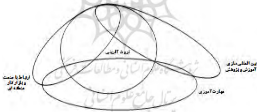
شکل ۱: مدل مفهومی مؤلفه‌های دانشگاه نسل چهارم

در مدل مفهومی پژوهش مؤلفه‌های دانشگاه نسل چهارم تحت تأثیر ۴ درونمایه و طبقات مربوط، طبق شکل زیر است: