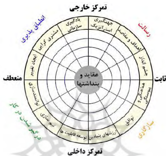
شکل ۱- مدل فرهنگ سازمانی دنیسون (Salari, 2016, Martanez & et al., 2012)

۴. رسالت: این ویژگی با سه شاخص گرایش و جهت‌گیری راهبردی، اهداف و مقاصد و چشم‌انداز اندازه‌گیری می‌شود. می‌توان گفت مهمترین ویژگی فرهنگ سازمانی رسالت و مأموریت آن است. گرایش‌های استراتژیک روشن جهت اهداف سازمانی را نشان می‌دهد و هر شخص می‌تواند خودش را در آن بخش (صنعت) مشارکت دهد. اهداف با استراتژی، مأموریت و افق دید سازمان پیوند یافته و سمت و سوی کار افراد را مشخص می‌کنند. چشم‌انداز سازمان یک دیدگاه مشترک از وضعیت آینده دارد. آن ارزش بنیادی را ابراز می‌کند، اندیشه و دل نیروی انسانی را با خود همراه ساخته و در همین زمان جهت را نیز مشخص می‌کند. همان‌طور که در مدل دنیسون (شکل ۱) مشخص است، این مدل دو محور عمودی و افقی دارد که مدل را به چهار قسمت تقسیم کرده است. محور عمودی دربرگیرنده میزان و تمرکز فرهنگ سازمانی است. این محور دو انتهای تمرکز داخلی و تمرکز خارجی دارد و محور افقی به میزان انعطاف‌پذیری اشاره دارد که از یک سمت به فرهنگ ایستا و از طرف دیگر، به فرهنگ منعطف ختم می‌شود (Martanez & et al., 2012).