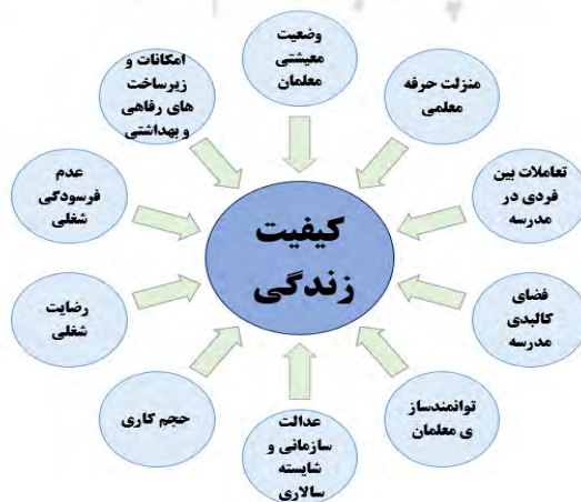
شکل ۱ - عوامل سازمانی - شغلی مؤثر بر کیفیت زندگی معلمان ابتدایی استان سیستان و بلوچستان

با توجه به نتایج به دست آمده در فرآیند تحقیق، عوامل سازمانی - شغلی مؤثر بر کیفیت زندگی معلمان ابتدایی استان سیستان و بلوچستان را می‌توان در قالب شکل ۱ ارائه کرد.