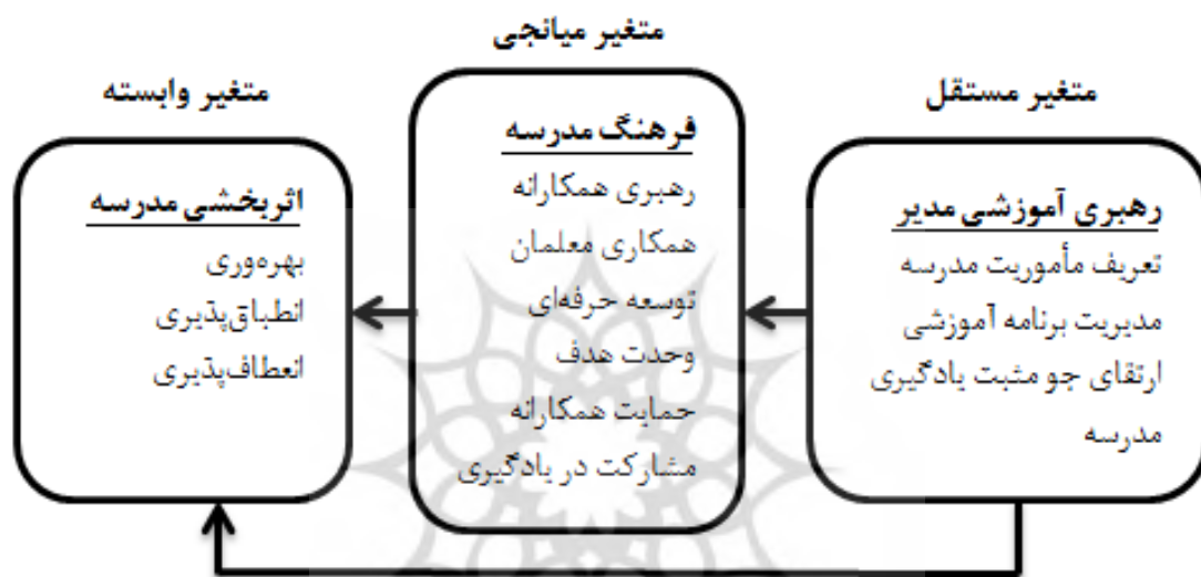
شکل ۱- مدل مفهومی پژوهش

با توجه به ادبیات و پیشینه نظری پژوهش، سه متغیر اثربخشی مدرسه، فرهنگ مدرسه و رهبری آموزشی برای مدل اثربخشی مدرسه در زمینه ایران (استان اردبیل) انتخاب شدند. مدل مفهومی پژوهش در شکل ۱ ارائه شده است. مدل علی مورد نظر این پژوهش بر اساس مدل های تحقیقاتی هست که توسط هالینگر و