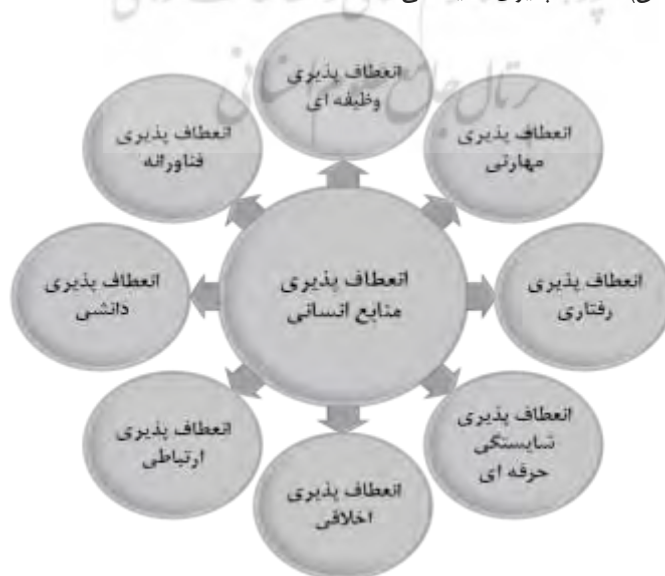
شکل ۳. مدل کیفی انعطاف‌پذیری منابع انسانی

با توجه به نتایج حاصل از روش فراترکیب و مصاحبه‌های انجام شده، مدل نهایی پژوهش به صورت شکل ۳ تدوین شد. الگوی انعطاف‌پذیری منابع انسانی شامل هشت بعد انعطاف‌پذیری وظیفه‌ای (با ۶ شاخص)، انعطاف‌پذیری مهارتی (با ۶ شاخص)، انعطاف‌پذیری رفتاری (با ۳ شاخص)، انعطاف‌پذیری شایستگی حرفه‌ای (با ۳ شاخص) و انعطاف‌پذیری اخلاقی (با ۳ شاخص) می‌باشد.