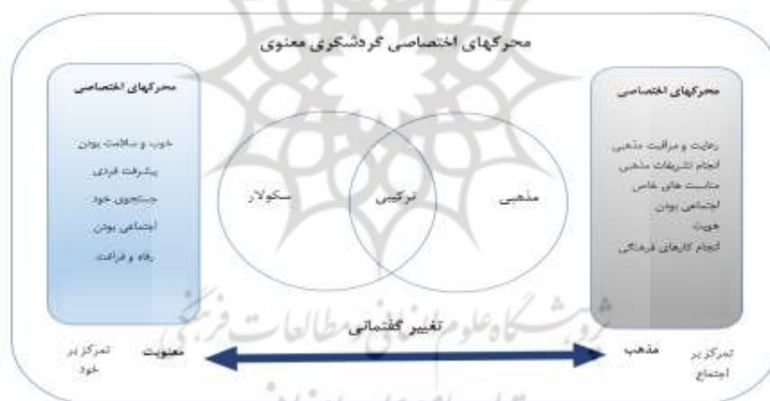
شکل ۱. محورهای اختصاصی گردشگری معنوی

گردشگری سکولار متفاوت خواهد بود (شکل ۱). همچنین می‌توان گفت که انگیزه معنوی گردشگران، نقش مهمی در تجربه گردشگری آن‌ها دارد. چیر و همکاران (۲۰۱۷)، انگیزه‌های گردشگران معنوی را به سه عامل مربوط می‌داند که شامل حرکت (هم فیزیکی و هم داخلی)، ارزش تجربی (اعتبار، منحصربه‌فرد و آرامش ذهن) و ویژگی‌های ذاتی مسیر گردشگران می‌باشد (Cheer et al., 2017). کوهن با تکیه بر نظر میچی (۲۰۰۱) معتقد است در گروه‌های خاصی از مسافران، شکل‌گیری هویت فردی جزء مهم‌ترین انگیزه‌های سفر محسوب می‌شود. برخورد با دیگران به‌عنوان راهی برای شناخت خود، تأمل در میراث اجدادی و تجربه چیزهایی که در موطن مسافر امکان تجربه آن‌ها وجود ندارد و گسترش جهان‌بینی، جنبه‌هایی از توسعه هویت هستند که در نتیجه مسافرت حاصل می‌شوند (Timothy & Olson, 2006). از این‌رو ویژگی‌های مقاصد گردشگری در کسب تجربه معنوی در تحقیقات متعدد، مورد تأکید قرار می‌گیرند.