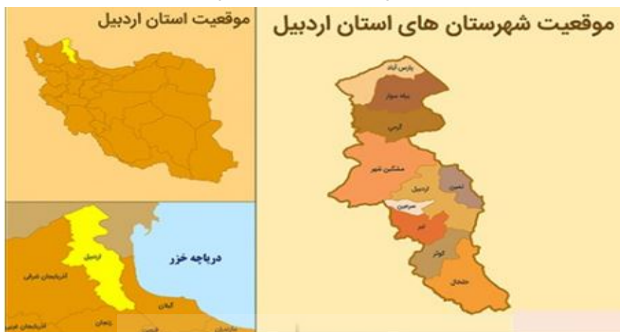
شکل ۱. موقعیت استان اردبیل