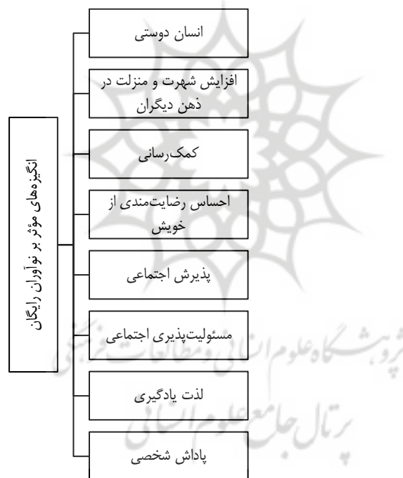
شکل ۲. انگیزه‌های مؤثر بر شکل‌گیری نوآوری رایگان