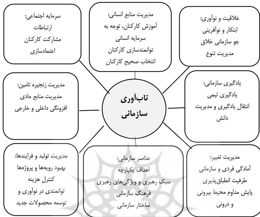
شکل ۲: عوامل تاثیرگذار بر تاب‌آوری سازمانی

سرمایه اجتماعی: زمینه بسیار مناسبی را برای بهره‌برداری و بهره‌وری نیروی انسانی در سازمان‌های مختلف فراهم می‌آورد و بهره‌گیری از سرمایه‌های دیگر سازمانی نیز در پرتو آن امکان‌پذیر است. ارزش‌هایی چون اعتماد و احترام (ابعاد سرمایه اجتماعی) سازمان‌ها را از طریق تسهیل روابط بین کارکنان (ارتباطات) و تشویق توزیع ایده‌ها و مشارکت در تسهیم دانش به سازمان یادگیرنده تبدیل کرده و نقش مهمی در تحقق دانش‌آفرینی و ظرفیت انطباق‌پذیری سازمانی ایفا می‌کند (Goucher, 2007). انطباق‌پذیری ناشی از سرمایه اجتماعی، نظامی از باورها و هنجارها را در سازمان شکل داده که توانایی سازمان برای دریافت، تفسیر و برگردان علایم محیطی به تغییرات رفتاری و همچنین ارزیابی و پاسخ‌دهی به تغییرات درون و برون سازمانی را تقویت می‌نماید و احتمال بقاء و رشد سازمان را افزایش می‌دهد. از سوی دیگر سرمایه اجتماعی از طریق ایجاد خطوط باز ارتباطات و ساخت ظرفیت شناخت مشترک، دانش‌آفرینی و خلق ایده‌های نو، تصمیم‌گیری گروهی و اشتراکی و برقراری جلسات تیمی مکرر و سازمان یافته، سازگاری با تغییرات را در سازمان تسهیل می‌کند چرا که با توسعه روابط سازمانی هزینه‌های ارتباط کاهش یافته و امکان استفاده از درس‌های آموخته شده و تجربیات دیگر سازمان‌ها فراهم می‌آید (Sellberg & et al, 2018, Galizia & et al, 2016, Auguata & et al, 2017, Duchek & bus, 2019, Barasa, 2018, Ston & Rahimifard, 2018, Duchek & et al, 2015, Kerr, 2018, Smith & et al 2016, Durach& et al, 2019).