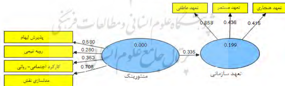
شکل شماره ۳: مدل معادله ساختاری ارتباط منتورینگ با تعهد سازمانی

جهت بررسی فرضیه ۳ پژوهش از رویکرد مدل‌سازی معادله ساختاری واریانس‌محور استفاده گردید، متغیرهای مستقل و وابسته پژوهش به صورت متغیرهای مکنون و در قالب مدل‌های عاملی مرتبه اول وارد مدل معادله ساختاری گردیدند، برآوردهای مربوط به شاخص‌های ارزیابی کلیت مدل و پارامترهای اصلی این مدل (ارتباط منتورینگ با تعهد سازمانی) در شکل (۳) و جداول (۵) و (۶) زیر گزارش شده است: