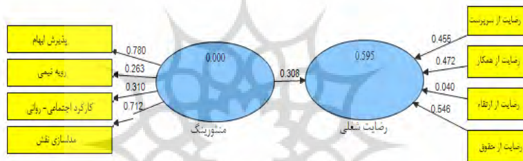
شکل شماره ۲: مدل معادله ساختاری ارتباط منتورینگ با رضایت شغلی

جهت بررسی فرضیه ۲ پژوهش از رویکرد مدل‌سازی معادله ساختاری واریانس‌محور استفاده گردید، متغیرهای مستقل و وابسته پژوهش به صورت متغیرهای مکنون و در قالب مدل‌های عاملی مرتبه اول وارد مدل معادله ساختاری گردیدند، برآوردهای مربوط به شاخص‌های ارزیابی کلیت مدل و پارامترهای اصلی این مدل (ارتباط منتورینگ با رضایت شغلی) در شکل (۲) و جداول (۳) و (۴) زیر گزارش شده است: