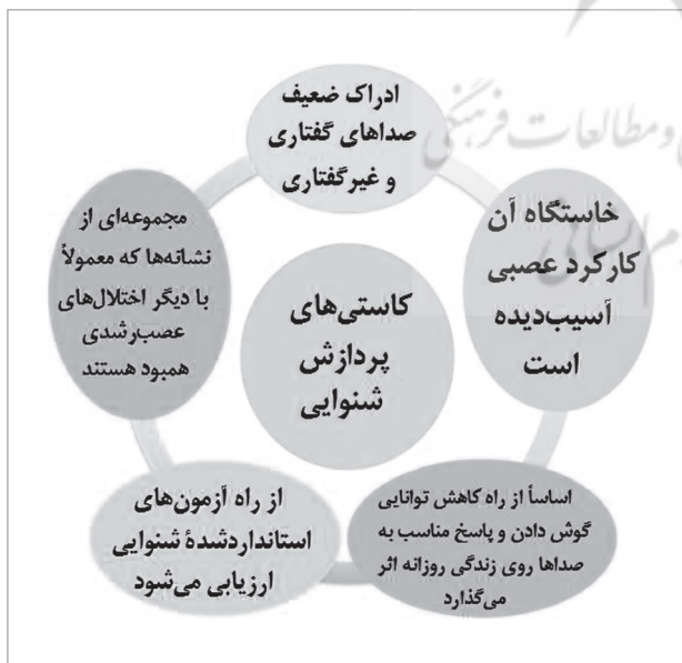
شکل ۲) تعریف کاستی‌های پردازش شنوایی (BSA, ۲۰۰۱) (۵).

این اصطلاح که به‌طور مناسبی جایگزین اصطلاح کاستی پردازش شنوایی مرکزی شده است بدون این که لزوماً مشکلات را به یک مکان کالبدشناختی نسبت دهد بر تعامل اختلال در هر دو دستگاه مرکزی و محیطی تأکید می‌کند. کاستی‌های پردازش شنوایی که در کودکان با شنوایی بهنجار موجب کاهش گستره توجه، و مهارت‌های گوش دادن ضعیف می‌شود و با کم‌شنوایی محیطی نیز همبود است (۹) دارای تعریف دقیقی نیست بلکه مجموعه‌ای از آسیب‌های کارکردی متفاوت را دربردارد (۸). به عبارت دیگر، تعریف جامع و پذیرفته‌شده‌ای از کاستی‌های پردازش شنوایی وجود ندارد و کاستی پردازش شنوایی به شیوه‌های مختلفی تعریف شده است. از جمله برحسب ویژگی‌ها، خاستگاه، اثر بر زندگی روزانه، روش‌های ارزیابی، و نشانه‌ها ۱ (شکل ۲)، یا بر اساس دسته‌بندی بین‌المللی کارکرد، کم‌توانی، و بهداشت (ICF) ۲ سازمان بهداشت جهانی ۳ (شکل ۳) (۵).