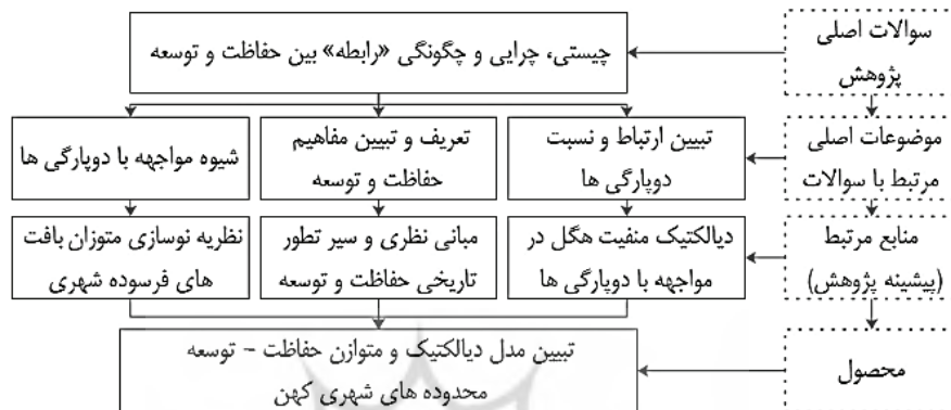
شکل ۱ - نمایش ارتباط منابع اصلی و پیشینه پژوهش در دستیابی به مدل دیالکتیک و متوازن حفاظت - توسعه محدوده‌های شهری کهن

فیلسوف عصر روشنگری (کهن، ۱۹۹۶) و هگل به عنوان مهم‌ترین فیلسوف مدرنیته (هابرماس، ۱۹۸۵ به نقل از جهانگل، ۲۰۱۳) به شیوه‌ای نظام‌مند به تبیین ماهیت و رابطه دویارگی‌ها پرداخته‌اند. و بویژه هگل با تدوین یک متدولوژی قدرتمند چارچوب عقلانی کارآمدی برای تبیین و حل تناقض‌های عقلی ارائه کرده است. (جهانگل، ۲۰۱۳) لذا این مقاله در یک پژوهش میان پارادایمی بین سه منبع اصلی «نظریه نوسازی متوازن بافت‌های فرسوده شهری»، «ادبیات نظری حفاظت و توسعه شهری» و «مدل دیالکتیک منفیت» در مواجهه با دویارگی‌ها و با هدف رفع تعارض و ایجاد ارتباط متعامل و هم‌افزا بین دو انگاره حفاظت و توسعه، در «تبیین مدل دیالکتیک و متوازن حفاظت - توسعه محدوده‌های شهری کهن» تلاش نموده است. در شکل ۲ چگونگی ارتباط منابع اصلی و پیشینه پژوهش در تدوین اهداف و دستیابی به مدل دیالکتیک و متوازن حفاظت - توسعه محدوده‌های شهری کهن نمایش داده شده است.