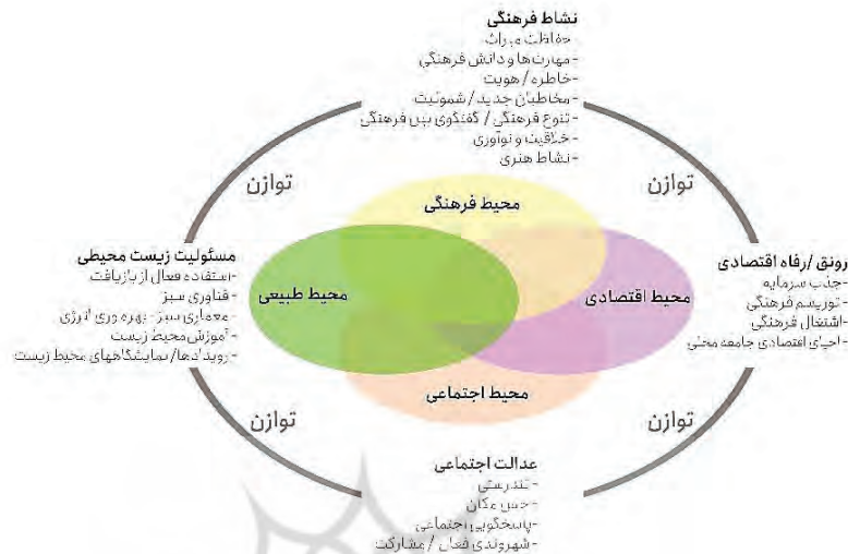
شکل ۲ - ابعاد ۴ گانه توسعه پایدار؛ فرهنگ به عنوان ستون توسعه پایدار، به طور کامل با سه مورد دیگر ارتباط دارد و آن‌ها را ارتقا می‌بخشد. برگرفته از: (sabatini, 2019)

توسعه به مثابه ظرفیت ارائه می‌دهد را می‌توان در فلسفه هگل یافت، دیالکتیک هگلی سه مرحله «نفی، حفاظت و توسعه» را شامل می‌شود. یک انگاره در مواجهه همزمان با خود و انگاره‌های دیگر از تناقض‌های درونی خود آگاه شده و بخشی از خود را نفی یا رد می‌کند و در عین حال از بخشی از خود حفاظت می‌کند و در فرآیند نفی، حفاظت و پذیرش خود و دیگری، انگاره، توسعه می‌یابد. (هگل به نقل از جهانبگلو، ۱۳۸۶) بنابراین توسعه زمانی تحقق می‌یابد که پیش‌تر و در فرآیند نفی، «ظرفیت» برای پذیرش دیگری در یک انگاره ایجاد شده باشد.