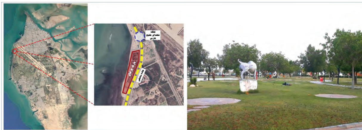
شکل ۳- تصویر و موقعیت پارک مرجان در شهر بوشهر

پارک شغاب: این پارک در بخش جنوبی شهر بوشهر (منطقه ۲) و در محله شغاب قرار گرفته است. پارک شغاب در حدود ۱۲۴۹۱۶ مترمربع مساحت دارد و بزرگ‌ترین پارک بوشهر است. قرارگیری این پارک در کنار ساحل و داشتن چشم‌اندازی زیبا، وجود امکانات نسبتاً مناسب برای گردشگران و مساحت زیاد فضای سبز باعث شده تا این پارک از محبوبیت بالایی برخوردار باشد (شکل ۴).