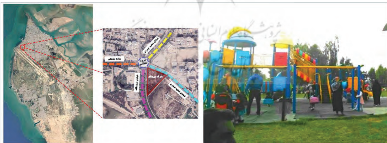
شکل ۲- تصویر و موقعیت پارک بن مانع در شهر بوشهر

پارک بن مانع: این پارک در بخش شمالی شهر بوشهر (منطقه ۱) و در محله بن مانع قرار گرفته است. پارک بن مانع حدود ۱۰۱۵۴ مترمربع مساحت دارد. این پارک به دلیل نزدیکی با سه خیابان شریانی فرودگاه، شهید چمران و ساحلی از اهمیت خاصی برخوردار است (شکل ۲).