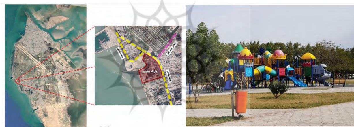
شکل ۴- تصویر و موقعیت پارک شغاب در شهر بوشهر

پارک شغاب: این پارک در بخش جنوبی شهر بوشهر (منطقه ۲) و در محله شغاب قرار گرفته است. پارک شغاب در حدود ۱۲۴۹۱۶ مترمربع مساحت دارد و بزرگ‌ترین پارک بوشهر است. قرارگیری این پارک در کنار ساحل و داشتن چشم‌اندازی زیبا، وجود امکانات نسبتاً مناسب برای گردشگران و مساحت زیاد فضای سبز باعث شده تا این پارک از محبوبیت بالایی برخوردار باشد (شکل ۴).