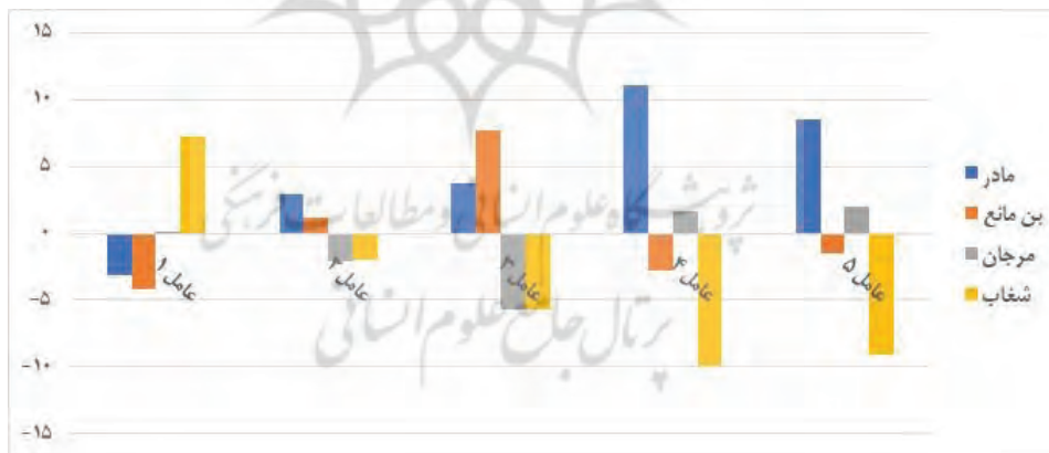
شکل ۵- مقایسه امتیازات عاملی پارک‌های شهر بوشهر

همانطور که در ستون آخر جدول ۵ مشاهده میشود، امتیاز نهایی هر پارک از مجموع عوامل فضای شهری دوستدار کودک به دست آمده است که در آن پارک مادر دارای برتری محسوس نسبت به سایر پارک‌ها است و پارک شغاب با کمترین امتیاز همراه بوده است. در تفسیر امتیاز بالای پارک مادر میتوان دلایل زیر را ذکر کرد: در ارتباط با عامل سرزندگی، وجود تحرک و جنب و جوش در پارک به دلیل حضور کودکان، نوجوانان و بزرگسالان، به کار رفتن رنگ‌های شاد در وسایل بازی، جذابیت پارک به دلیل وجود وسایل بازی متنوع، وجود فضای سبز و گیاهان اطراف محوطه بازی، تنوع مبلمان و مصالح به کار رفته در پارک، وجود کافه‌ها در پارک، زمین بازی و فضای نشستن که همگی موجب بروز فعالیت‌های مختلف میشوند و وجود کودکان شاد و پرهیجان در پارک و تعاملات آنها با یکدیگر را ذکر کرد. در ارتباط با عامل کارایی می‌توان به اندازه‌ی مناسب وسایل بازی برای استفاده‌ی کودکان، نبود زباله در زمین بازی و حضور کودکان با جنسیت‌ها و قومیت‌های مختلف را ذکر کرد. در مورد عامل امنیت، استفاده از کف پوش نرم برای زمین بازی و وجود نور کافی در شب، زمینه ساز آن هستند. در ارتباط با عامل خوانایی، وجود نشانه‌های قابل تغییر برای کودکان، سالم بودن بسیاری از مبلمان پارک و آشنا بودن نام پارک مادر برای کودکان را می‌توان ذکر کرد. در مورد عامل نظارت پذیری نیز می‌توان نظارت مناسب بر کودکان توسط والدین در پارک را مشاهده کرد. به منظور نمایش بهتر تفاوت پارک‌ها در عوامل ۵ گانه نمودار میله‌ای آن ترسیم شده است (شکل ۵).