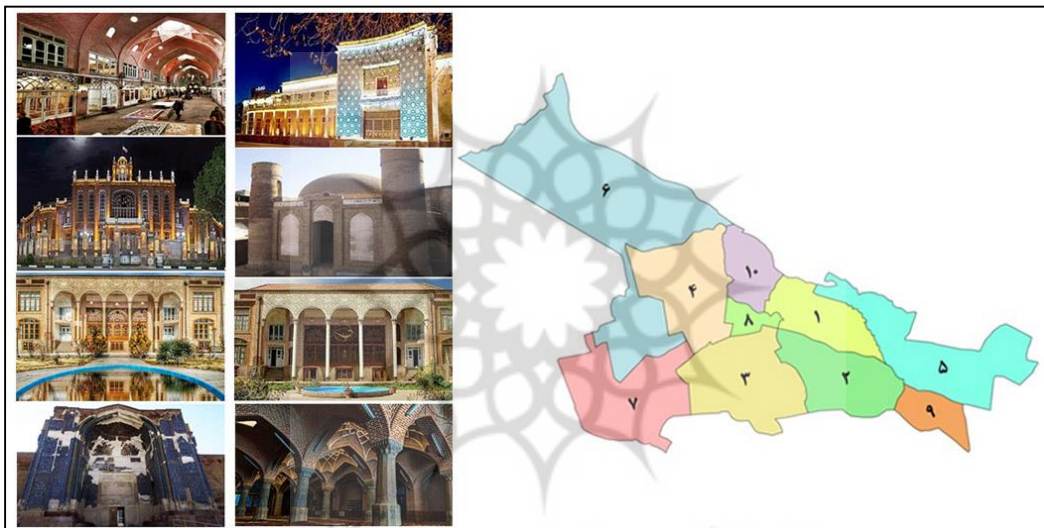
شکل ۱. موقعیت جغرافیای حوزه شهرداری فرهنگی - تاریخی منطقه ۸ تبریز و عکس بناهای تاریخی آن

دلیل قدمت زیاد، تجمع مراکز تجاری و تفریحی و کارگاه‌های تولیدی، استانداری، اداره دارایی و مالیات، فرمانداری شهرستان تبریز، بانک ملی مرکزی استان و همچنین وجود شعبات مختلف بانک‌ها و سایر دفاتر خدماتی، است که منجر به تردد زیاد شهروندان از تبریز و سایر شهرستان‌های استان به این منطقه می‌شود بافت قدیمی شهر تبریز که در حوزه شهرداری فرهنگی - تاریخی منطقه ۸ تبریز قرار دارد، شامل هفت محله اصلی بوده که عبارت‌اند از: بازار، شهناز، مقصودیه، دانشسرا، منصور، قره باغ-بالاحمام و تپلی باغ-دمشقیه. مهمترین چالش‌های این منطقه عبارت‌اند از: ترافیک سنگین، بناهای فرسوده، سختی خدمات رسانی، معابر قدیم که به صورت ارگانیک و غیر فنی ساخته شده‌اند، کمبود شدید فضای سبز، و غیره. شاخص‌ترین بناهای تاریخی قرار گرفته در این منطقه عبارت‌اند از: بازار سرپوشیده تبریز به عنوان بزرگ‌ترین بنای سرپوشیده جهان که در فهرست میراث جهانی یونسکو ثبت شده است. مسجد جامع تبریز، مسجد ۶۳ ستون، مسجد چهار منار، خانه مشروطه، ساختمان بانک ملی، خانه حیدر زاده، خانه قدکی، موزه مشروطه، پیاده‌راه تربیت، مسجد کبود، عمارت شهرداری، کاخ استانداری بخشی از این آثار تاریخی هستند که در محدوده حوزه شهرداری فرهنگی - تاریخی منطقه ۸ تبریز قرار دارند (شکل ۱).