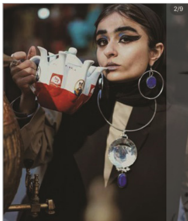
تصویر ۴: حضور ابژه‌های روزمره،omidshi، اینستاگرام فارسی

پروژه مدرنیته با رؤیای دستیابی به سعادت از طریق تکیه صرف بر خرد انسانی، نه تنها با شکست روبه‌رو شده که از انسان، موجوداتی بریده بریده و پراکنده باقی گذاشته است. «حاصل آن [مدرنیته] برای ما آشفتگی کامل و به تعبیری، عدم امکان درک اصول تعیین‌کننده زیبایبی‌شناختی، جنسی یا سیاسی است» (بودریار، ۱۳۹۶: ۲۰). به این ترتیب، تردید درباره خرد سوژه‌محور دکارتی به‌عنوان فصل مشترک پسامدرنیسم، ما را