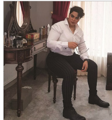
تصاویر ۸ و ۹. فراجنسیت، دگرجنس پوشی مردان.omidshi. اینستاگرام فارسی (نگارندگان)