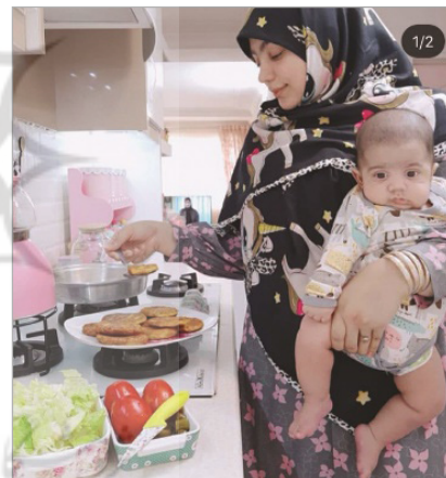
تصویر ۳: نمایش زندگی روزمره، swet_home_atefeh، اینستاگرام فارسی