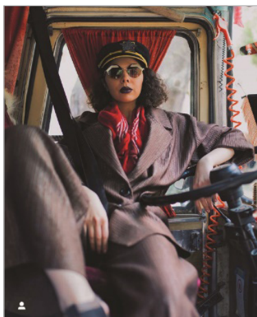
تصویر ۶: پدیده کیچ، hanaafardin، اینستاگرام فارسی (نگارندگان)