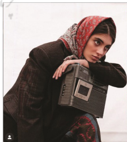
تصویر ۵: بازسازی گذشته، persia.vogue، اینستاگرام فارسی (نگارندگان)