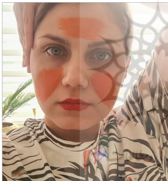
تصویر ۱. بدن به مثابه ابزار انتقال پیام. #خشونت-علیه-زنان، اینستاگرام فارسی (نگارندگان)

بودریار با رهایی جامعه از اشکال، خطوط، رنگ‌ها و ایده‌های زیبایی‌شناختی، ظهور نوعی زیبایی‌شناسی عام را اعلام کرد و با رهایی هنر رسانه‌ای و معاصر از جنبه آرمان‌شهری می‌نویسد: «به لطف رسانه، علوم کامپیوتر و تکنولوژی‌های تصویری، اینک