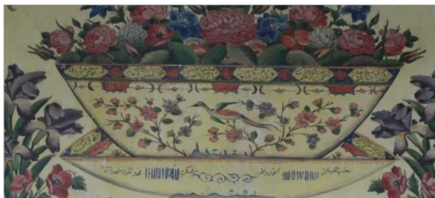
تصویر ۱. تصویر مرجع تشخیص کارفرما، هنرمند و تاریخ انجام نقاشی‌های دیواری (نگارندگان)

اگرچه بینامتنیت ابتدا در حوزه ادبیات ظهور یافت، ولی