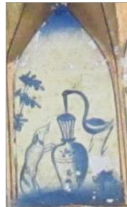
تصویر ۴. همگونی پیش‌متن و پیش‌متن در موضوع روایت لک‌لک و روباه ۱۸ تصویر خانه حقیقی (نگارندگان)، تصویر فنجان (URL: 4)