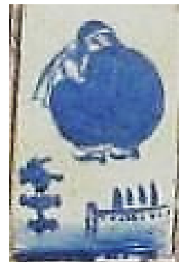
تصویر ۶. تراگونی فرهنگی، حفظ فیگور نشسته از پشت و حذف کلی موضوع و تغییر جنسیت و ماهیت تصویر خانه حقیقی (نگارندگان)، تصویر کاشی (URL: 6)