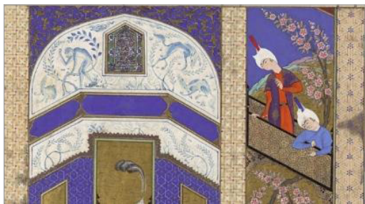
تصویر ۳. قسمتی از نگاره رستم در کین‌خواهی سیاوش اثر میر معصوم، شاهنامه طهماسبی (URL: 1)