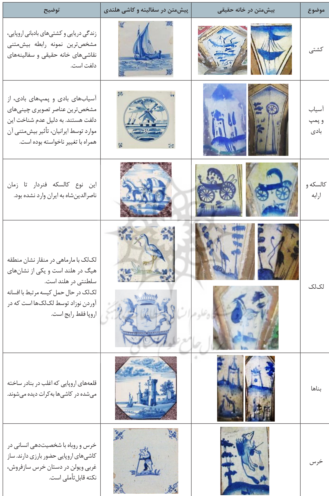
جدول ۱. بررسی روابط تصویری بیش‌متنی نقاشی‌های دیواری لاجوردی خانه حقیقی با سفالینه‌های دلفت