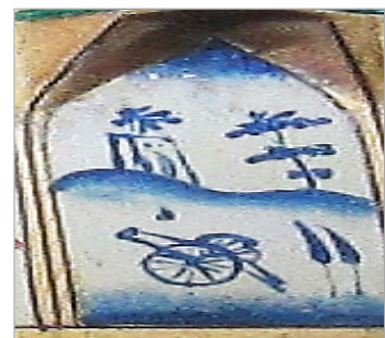
تصویر ۵. همان‌گونه چرخ چاه یا تراگونی آسیاب بادی به ساختمانی با چرخ یا لکه بر فراز آن تصویر خانه حقیقی (نگارندگان)، تصویر فنجان (URL: 5)