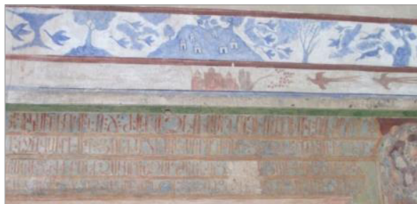
تصویر ۲. نقاشی‌های لاجوردی در حاشیه نقاشی اصلی بالای شومینه خانه هراتیان (نگارندگان)