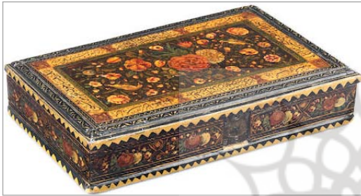
تصویر ۱۲. در روی جعبه مزین به نقش گل و مرغ و کتیبه سنجش اعمال، ابعاد جعبه: ۱۴٫۶ × ۵٫۲ × ۲۵٫۱ (URL: 1)