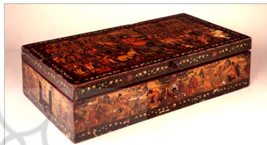
تصویر ۱۵. قسمت عرض جعبه؛ صحنه شکار شاهزادگان قاجاری (URL: 2)