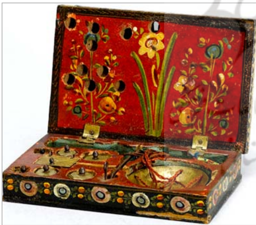
تصویر ۹. داخل جعبه منقوش به گل زنبق و دو دسته گل (URL: 1)