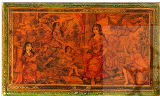
تصویر ۸. داخل جعبه منقوش به فرشتگان و در مرکز یک فرشته با ترازو (URL: 1)