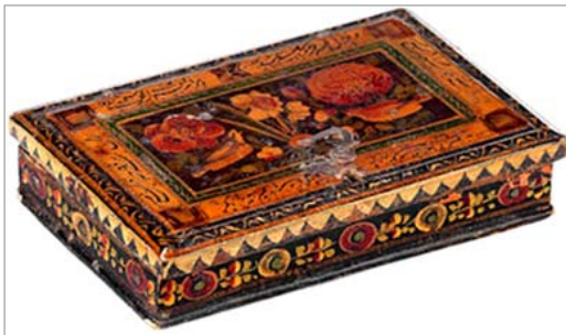
تصویر ۱۰. روی جلد جعبه نقاشی با گل و پرنده (گل و مرغ) (URL: 1)