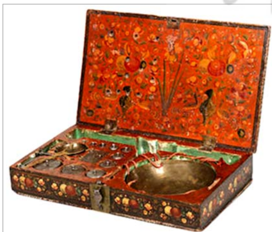
تصویر ۴. نمای داخل جعبه- قپان از کنار (URL: 1)

تمام قسمت‌های چوبی جعبه نقاشی شده و در داخل و خارج آن با نقوش متنوع پرتزئین کار شده و لاک الکل خورده‌اند. نقش اصلی در تزئینات داخل جعبه گل بوده و ربطی به موضوع شاه و فرزندان ندارد. فضای داخلی جعبه پشت در، منقوش به گل زنبقی در وسط و اطراف آن، نقش گل و پرندگان است. داخل جعبه تقسیم‌بندی مشخصی دارد و ترازو و دوازده عدد وزنه برنجی در اوزان مختلف در جعبه چوبی نگهداری می‌شوند.