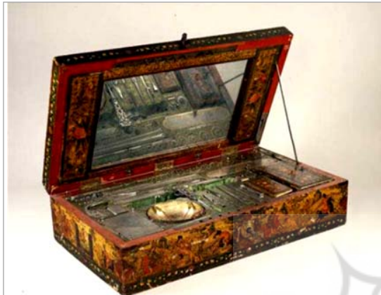
تصویر ۱۶. جعبه به صورت نیمه‌باز و انعکاس وزنه‌ها در آینه (URL: 2)

شد، مشخص شد که جعبه قبان‌های قاجار در جنس چوبی جعبه، نقاشی لاک‌ی تصاویر و ویژگی‌های تجسمی با یکدیگر مشابهت داشتند و همچنین برخی از نقوشی که در این جعبه‌ها به کار رفته شده مانند نقوش گل و مرغ، فرشتگان و ... مشابه یکدیگر بوده‌اند. در جدول ۱ به تحلیل دقیق‌تر این