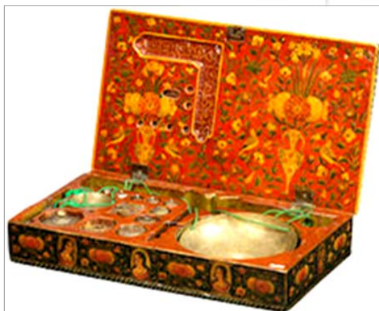
تصویر ۶. داخل جعبه ترازو، منقوش به گل و پرندگان (URL: 1)

صندلی شاهی نشان می‌دهد که به وسیله فرزندان ذکور احاطه شده است. این موضوع، یکی از موضوعات رسمی درباری در هنرهای مختلف در دوره اول قاجار است. فتحعلی‌شاه با تاج تصویر شده و عباس میرزا نایب‌السلطنه در کنار او و جلوتر از برادران در کنار شاه قرار دارد که تأکیدی بر ولیعهدی او است. اطراف تصویر مرکزی دارای کتیبه‌های طلائی منقوش به گل‌های متنوع است که ارتباط فضای داخل و خارج نقاشی را به لحاظ تصویری برقرار می‌کند. فضای داخل در با گل زنبقی در مرکز و اطراف آن با گل‌های فراوان تزئین شده است. تمام بخش‌ها با نقوش پرکار تزئین شده‌اند.