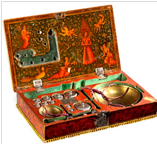
تصویر ۷. روی جعبه مریم و مسیح به شیوه قاجاری و فرشتگان (URL: 1)