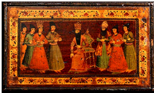
تصویر ۲. جعبه قپان نقاشی‌شده با نقش فتحعلی‌شاه و پسران، کیفیت عالی، دوره قاجار، ایران، قرن نوزدهم م.، ۶ × ۳۲ × ۱۹ cm (URL: 1)

داخل وزنه‌ها کلمه هاشمی نوشته شده است. این جعبه، کیفیتی بالاتر از لحاظ نقش و اجرا با دیگر جعبه‌های معرفی شده در ادامه دارد. تصویر روی در جعبه، به موضوع رسمی فتحعلی‌شاه و پسران اشاره دارد و فتحعلی‌شاه را در مرکز تصویر نشسته بر