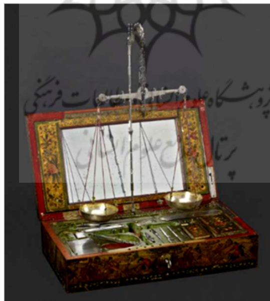
تصویر ۱۷. جعبه باز و قرارگیری دو کفه ترازو در جعبه (URL: 2)