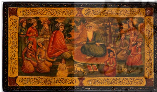
تصویر ۵. روی جعبه ترازو، پیرمردی در مرکز و جوانان با تزئین کتیبه‌هایی از اشعار فردوسی (URL: 1)

نقاشی در این تصاویر، متأثر از نقاشی قلمدان‌های صفوی در موضوعات مسیحی بوده است. در نقاشی اصلی روی در بیرونی جعبه، چهار فرشته دیده می‌شود که پیرمردی در گوشه سمت چپ تصویر شده است. فضای داخل نقاشی با رنگ سبز کار شده است که فرشتگانی در حال پرواز هستند. فضای داخلی در جعبه، زنی ایستاده را نشان می‌دهد که با