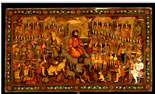
تصویر ۱۴. تصویر در روی جعبه؛ حضرت سلیمان، دیو و حیوانات، سپاهیان و درباریان (URL: 2)

آینه‌ای قرار دارد که بالای آن نام حضرت علی (ع) و فرزندان ایشان امام حسن (ع) و امام حسین (ع) نوشته شده است. در عرض و کناره‌های جعبه، شاهزادگان قاجاری در حال شکار تصویر شده‌اند. وزنه‌های جعبه فولادی بوده و دارای روکش نازکی از طلا هستند. در تصویر، هوپو حکیم حضرت سلیمان و هدهد پرنده او و در حاشیه پایین جعبه، حضرت یوسف و پوتیفار مصری همسر اول زلیخا نقاشی شده است. آویز فلزی و نخ ابریشمی به رنگ بنفش، ترازو را وصل می‌کند. ابعاد جعبه ۱۶ × ۵۰ × ۳۷ است (URL: 2) (تصاویر ۱۷-۱۴).