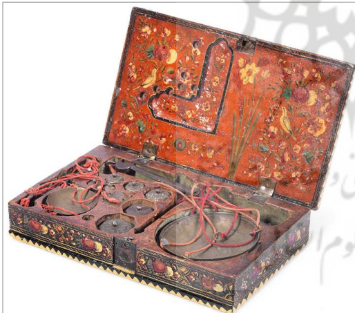
تصویر ۱۳. داخل در جعبه منقوش و وزنه‌های قابل حمل (URL: 1)