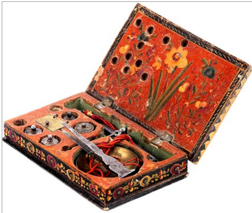
تصویر ۱۱. تصویر از کنار جعبه و مشخص بودن وزنه‌های قابل حمل (URL: 1)