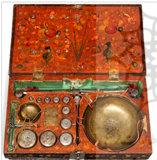
تصویر ۳. نمای داخل جعبه- قپان از بالا (URL: 1)

در این بخش، به مطالعه جعبه- قپان‌های دوره قاجار به شیوه نقاشی لاک‌ی که در بخش قبل شیوه و روش کار آن توضیح داده شد، پرداخته می‌شود. طول و عرض و داخل جعبه‌ها همه دارای نقاشی به شیوه لاک‌ی با نقوش متنوع هستند. در این بخش، پنج جعبه قپان نقاشی‌شده در حراج بونامز انگلستان و یک نمونه در موزه بریتانیا مورد بررسی و تحلیل قرار می‌گیرد. تمامی این جعبه‌ها به صورت جعبه چوبی، نقاشی شده و دارای لاک برای پوشش جعبه هستند. تمام بخش‌های جعبه‌ها روی چوب نقاشی شده و در داخل جعبه، تقسیم‌بندی برای اوزان مختلف طراحی شده است. • جعبه اول: جعبه- قپان قاجاری با موضوع فتحعلی‌شاه و پسران که یکی از موضوعات اصلی و رسمی و درباری در دوران اول قاجار است که در هنرهای مختلف دیده می‌شود. انتخاب این موضوع نشان می‌دهد که این جعبه به سفارش دربار کار شده است. این جعبه شامل مجموعه‌ای از اوزان و مقیاس‌ها برای اندازه‌گیری به صورت قابل حمل است. دور نقاشی، کتیبه گل‌دار طلایی در اطراف و حاشیه است. ابعاد جعبه چوبی ۱۹×۳۲×۶ سانتی‌متر هستند (تصاویر ۲-۴).