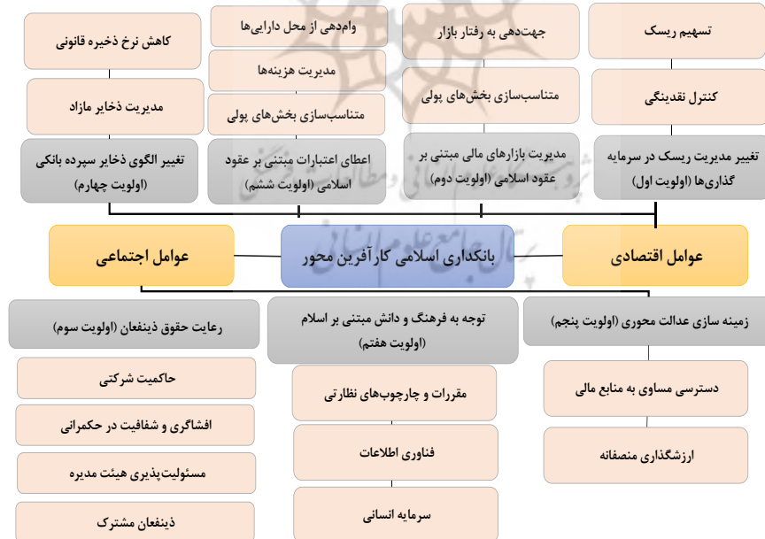
شکل ۳. عوامل مؤثر بر بانکداری اسلامی با تأکید بر توسعه کارآفرینی