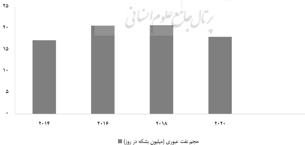
نمودار ۲- چه میزان نفت از تنگه هرمز عبور می‌کند؟ (در بازه ۵ ساله)