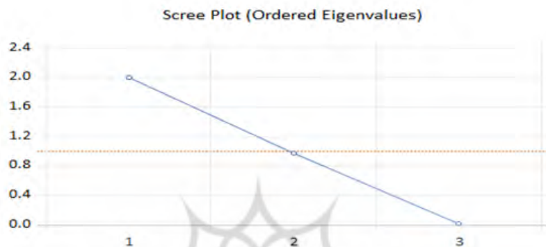
نمودار ۳. مولفه‌های شاخص ترکیبی ردپای اکولوژیکی

با توجه به اینکه سه شاخص GPP, EFTP, EFTRN بیانگر شاخص ردپای اکولوژیکی هستند، با استفاده از روش PCI مولفه‌های اصلی این شاخص تبدیل به یک شاخص ترکیبی می‌شود؛ با توجه به سه متغیر، حداکثر سه مولفه اصلی وجود خواهد داشت که با PC1, PC2, PC3 نشان داده شده است؛ مولفه اول (PC1) و مولفه دوم (PC2) و مولفه سوم (PC3) به ترتیب، ۶۷ و ۳۳ و ۰/۷ درصد از تغییرات شاخص ترکیبی ردپای اکولوژیکی در کشورهای OECD را توضیح می‌دهد. با توجه به آزمون اسکری ۱ - که در نمودار (3) آورده شده است - از بین این سه مولفه، مولفه اول، بیشترین توضیح‌دهندگی تغییرات شاخص ترکیبی ردپای اکولوژیکی را دارد و گفتنی است که شاخص ترکیبی براساس این مولفه ساخته می‌شود.