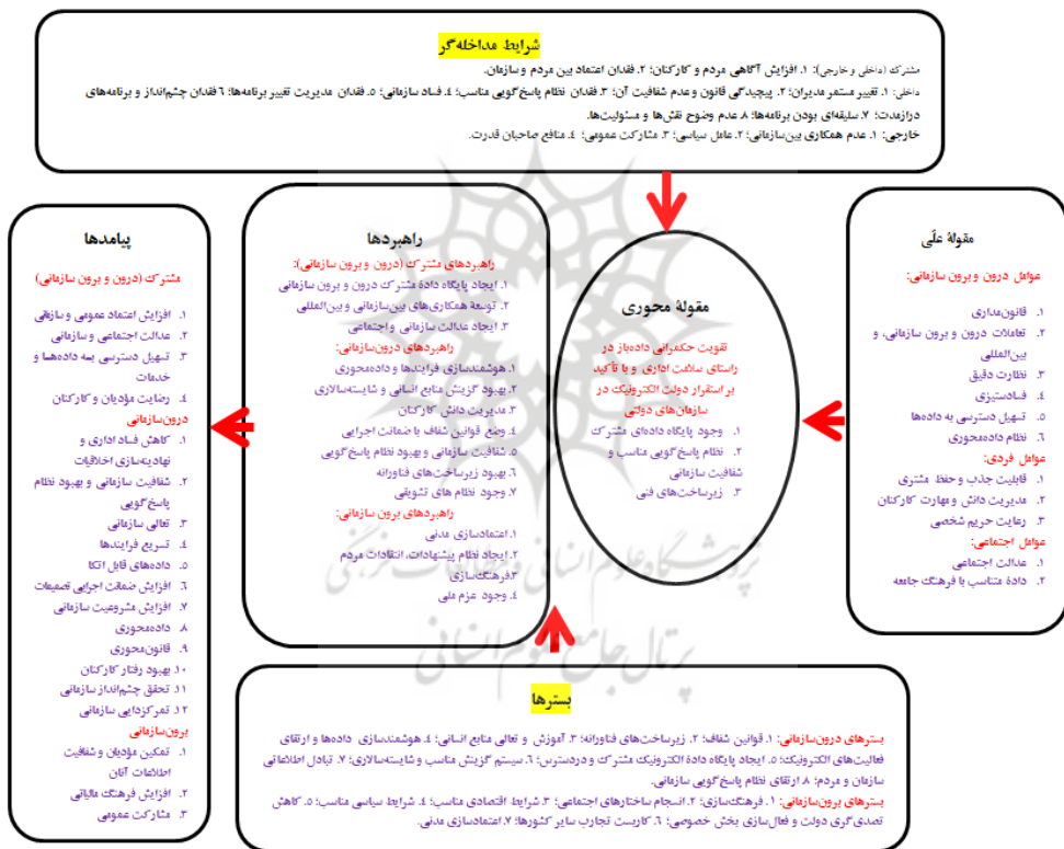
شکل ۲. طراحی الگوی تقویت حکمرانی داده‌ها در راستای سلامت اداری و با تأکید بر استقرار دولت الکترونیک در سازمان‌های دولتی

همان‌طور که در این جدول مشاهده می‌شود، تمام مقوله‌ها ابتدا به‌طور کلی و طبق حوزه‌های مورد مطالعه و سپس در قالب شش ستون اصلی شامل مقوله‌های محوری، بسترها، پیامدها، شرایط مداخله‌گر، علی و راهبردها طبقه‌بندی شد. از آنجا که تعداد مقوله‌ها نه‌فقط فراوان، بلکه بعضاً مشابه و متداخل است، عملیات کدبندی محوری دوباره انجام شد و تعداد محدود و انتزاعی‌تری از مقوله‌ها استخراج گردید. سپس مجدد مقوله هسته نهایی، یعنی انتزاعی‌ترین سطح مفهومی، انتخاب شد تا بتواند تمام مقوله‌های فوق را در بر گیرد و خصوصیت تحلیلی نیز داشته باشد. در نهایت مدل زمینهای نهایی حول مقوله هسته ترسیم گردید.