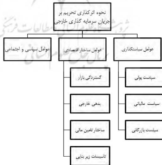
شکل شماره (۲) نحوه اثرگذاری تحریم‌ها بر جذب سرمایه‌گذاری خارجی