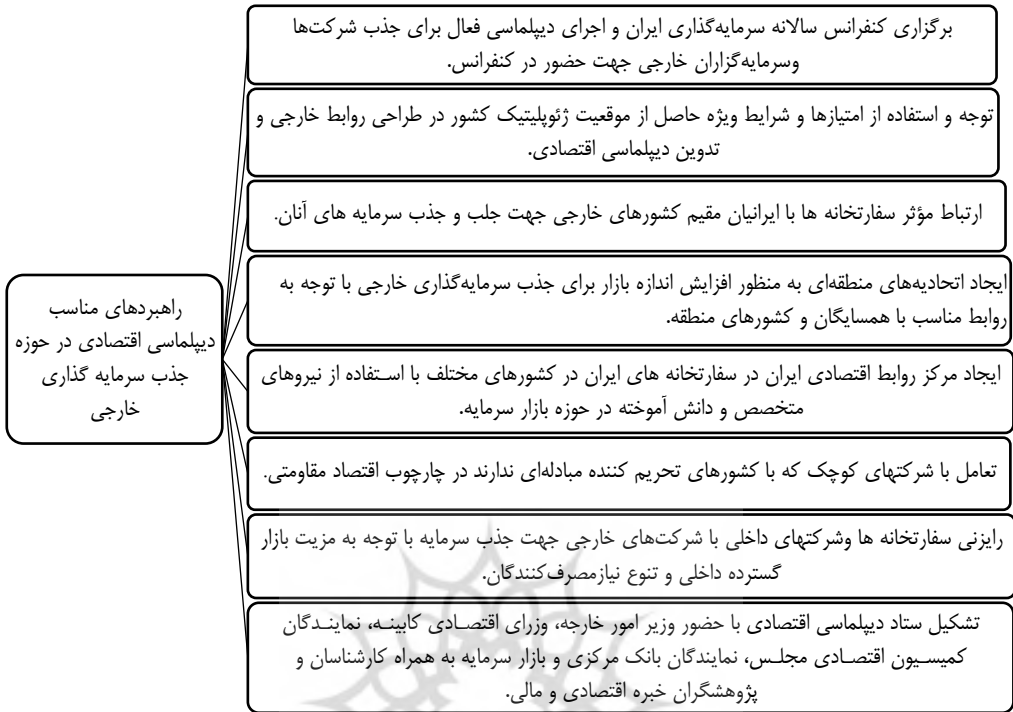
شکل شماره (۲) راهبردهای مناسب دیپلماسی اقتصادی در حوزه جذب سرمایه‌گذاری خارجی