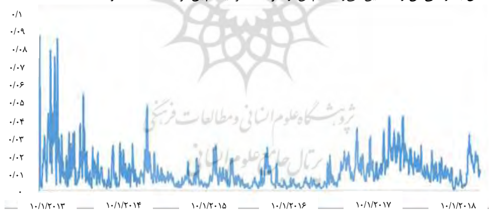
شکل شماره (۷) تخمین واریانس مشروط لگاریتم بازدهی روزانه بیت کوین

بازدهی حاصل از طلا و نفت در پیش‌بینی نوسانات بیت کوین قابل توجه هستند، اما ضریب نسبتاً کوچک آن‌ها به این معنی است که نوسان بیت کوین نسبت به تغییرات قیمت آن‌ها بسیار حساس نیست. یکی دیگر از یافته‌های قابل توجه، این است که یک شوک مثبت به USD، نوسان بیت کوین را کاهش می‌دهد. توضیحی که می‌توان داد این است که بیت کوین به عنوان یک دارایی یا یک کالای سرمایه‌ای عمل می‌کند. هنگامی که ریسک افزایش در نگهداری USD وجود دارد، افراد بیشتری ارز خود را به بیت کوین تبدیل می‌کنند و بنابراین حجم مبادلات را افزایش می‌دهند که در نتیجه نوسان بیت کوین را کاهش می‌دهد. تخمین واریانس مشروط لگاریتم بازدهی روزانه بیت کوین را می‌توان در شکل (۷) مشاهده کرد. همانطور که در شکل مشخص است نوسان‌ها به مرور پس از انتشار بیت کوین و عبور از دوره انتشار اولیه خود کم شده‌اند و مدل به‌درستی آن را تخمین می‌زند اما پس از شوک ممنوعیت چین نوسانات شدت گرفته‌اند.