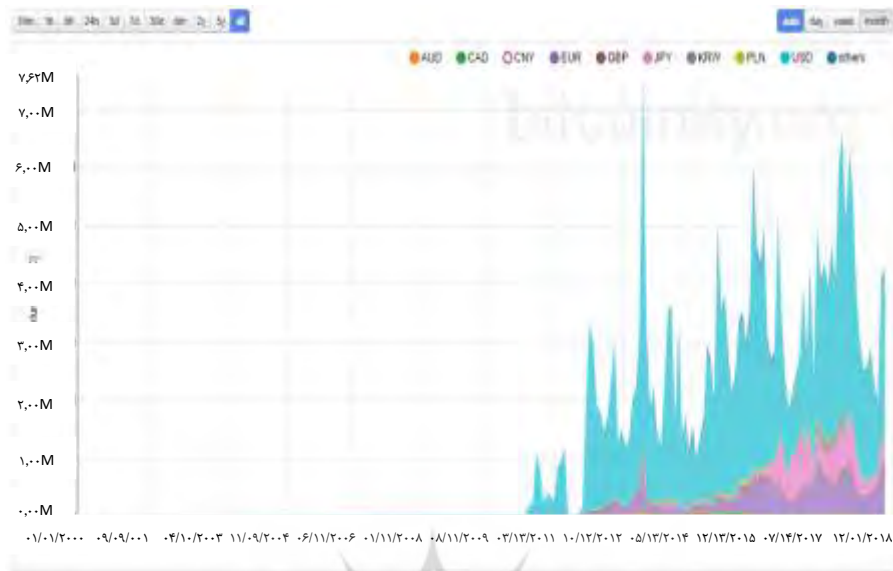
شکل شماره (۵) حجم معاملات بیت کوین به تفکیک ارز مورد استفاده به استثنای یوان

شاخص‌های اقتصاد کلان توصیه‌شده توسط ادبیات با مشاهدات روزانه، نرخ مبادله ارز، شاخص بازار سهام، بازده اوراق قرضه ۱۰ ساله و نرخ بهره بین‌بانکی ۳ ماهه است. نرخ ارز نشان‌دهنده قدرت اقتصاد کلان یک کشور است، شاخص بازار سهام نشان‌دهنده وضعیت بازار سهام است، بازده اوراق قرضه دولتی نشان‌دهنده بازار اوراق قرضه و نرخ بهره بین‌بانکی ۳ ماهه نشان‌دهنده وضعیت بخش بانکی است؛ بنابراین متغیرهای بیرونی توضیحی عبارت‌اند از: جفت ارزهای JPY/USD , EUR/USD , CNY/USD ، BTC/USD که برای راحتی در ادامه تنها از نام آن ارز (برای نمونه CNY به جای CNY/USD ) استفاده می‌شود و قیمت هر اونس طلا، قیمت جهانی نفت برنت، شاخص بازار سهام شانگهای، S\&P500 ، شاخص بازار سهام منطقه اروپا stoxx50 ، شاخص بازار سهام ژاپن NIKKEI225 ، اوراق قرضه دولتی ۱۰ ساله کشورهای چین، ایالات متحده، آلمان و ژاپن، نرخ بهره بانکی ۳ ماهه در کشورهای چین، ایالات متحده، اروپا و ژاپن. همه متغیرهای اقتصاد کلان توضیحی را می‌توان در جدول (۲) مشاهده کرد. همه داده‌ها از بانک اطلاعات اقتصادی ( FRED ) ۱ و بانک تجارت اقتصادی ۲ گرفته شده است.