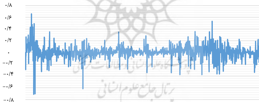
شکل شماره (۶) آزمون خوشه‌بندی نوسانات در جملات اخلاص

نتایج آزمون خوشه‌بندی نوسانات در جملات اخلاص را می‌توان در شکل (۶) مشاهده کرد. شکل نشان می‌دهد، دوره‌هایی که نوسان پایین در جملات خطا یافت می‌شود با دوره‌های نوسان پایین همراه می‌شوند. این نشان می‌دهد که پس از بازدهی‌های بزرگ ما انتظار بازدهی بزرگ را خواهیم داشت و بازدهی‌های کوچک با بازدهی کوچک دنبال می‌شوند که به معنی آن است که جملات اخلاص به طور مشروط خودهمبستگی دارند؛ بنابراین، پیش شرط اول برآورده می‌شود و ما می‌توانیم به پیش شرط دوم برویم: آیا مدل ARCH بر جملات اخلاص اثر می‌گذارد؟