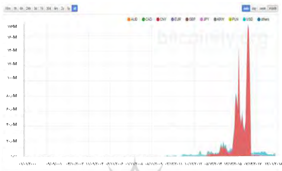
شکل شماره (۴) حجم معاملات بیت کوین به تفکیک ارز مورد استفاده

همانطور که در شکل (۴) نیز مشهود است، یوان (CNY) پیش از اعمال ممنوعیت‌های چین بر حجم مبادلات تجاری تسلط داشت. در صورتی که همان نمودار شکل قبل را بدون یوان در نظر بگیریم وضعیت سایر ارزها مشخص خواهد شد. از شکل (۵) در می‌یابیم که دومین واحد پول مبادله شده در بیت کوین دلار آمریکا (USD) است که پس از آن به ترتیب یورو (EUR) و ین (JPY) قرار گرفته‌اند. ارزهای دیگر حضور قابل توجهی در مبادلات بیت کوین ندارند. در نتیجه، می‌توان فرض کرد که چین و ایالات متحده مهم‌ترین عامل خارجی هستند که بر نوسانات بیت کوین تأثیر می‌گذارند، پس از آن اتحادیه اروپا و ژاپن؛ بنابراین، برای توضیح نوسانات نرخ رمزارز بیت کوین، از شاخص‌های کلان اقتصاد در این سه کشور و اتحادیه اروپا استفاده خواهیم کرد. علاوه بر این متغیرهای کلان اقتصادی، همچنین از قیمت طلا و قیمت نفت به عنوان دو شاخص اقتصادی اثرگذار استفاده خواهیم کرد.