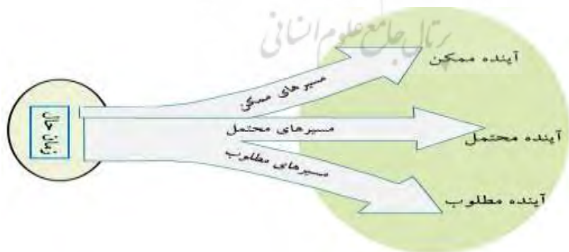
نمودار شماره (۲) روابط بین آینده‌های ممکن، محتمل و مطلوب

سناریوها با پیشگویی‌ها، پیش‌بینی‌ها و چشم‌اندازها، فرق می‌کنند. سناریوها، توصیف‌هایی روشن از آینده‌های قابل قبول ارائه می‌دهند. نمودار (۲) تفاوت‌های بین سه دسته اصلی آینده‌ها را نشان می‌دهد. بر اساس نمودار (۲)، در روش سناریو، بر اساس مسیرهای ممکن پیش‌رو، آینده‌های ممکن ارزیابی می‌شود که این موضوع با آینده نظام بازنشستگی با توجه به پارامترهای جمعیتی و اقتصادی (نظیر نرخ سود، تورم، نرخ تنزیل) مطابقت دارد.