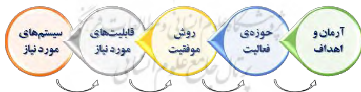
شکل شماره (۳) مدل لافلی