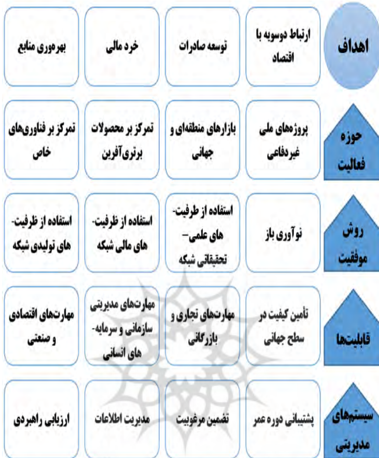
شکل شماره ۵) ترجمان اقتصاد مقاومتی در صنعت دفاعی مبتنی بر مدل لافلی ۱