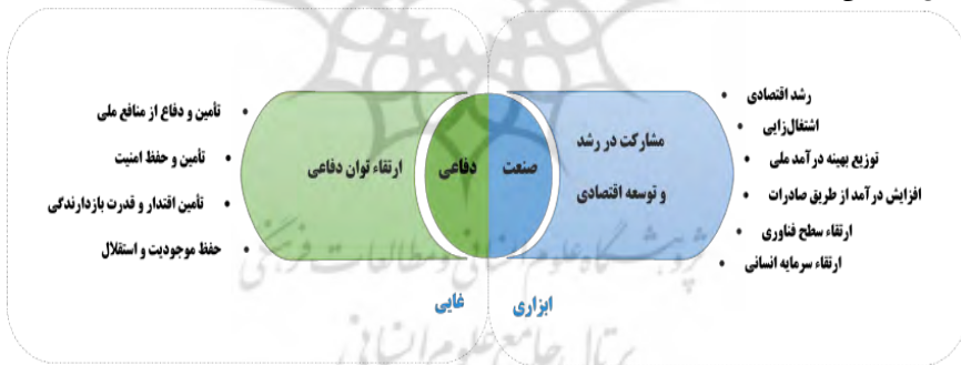
شکل شماره (۱) کارکردها و اهداف صنایع دفاعی (پژوهشگران)

نظامی شامل عناصر متعددی در نظر گرفته می‌شود که تسلیحات، تجهیزات و پشتیبانی تأمین آن‌ها - یعنی محصولات صنعت دفاعی - بخش مهمی از این عناصر قلمداد می‌گردد (آذرلی، ۱۹۹۶). پس می‌توان گفت هدف اصلی (غایی) صنعت دفاعی، افزایش توان دفاعی از طریق خودکفایی و عدم پذیرش وابستگی امنیت نظام به کشورهای بیگانه است و پیامد آن نیز، تحقق مأموریت پیش گفته است. امروزه صنعت دفاعی اهداف دیگری را نیز دنبال می‌نماید که آن‌ها را فرعی یا ابزاری می‌دانیم. شاید مهم‌ترین هدف ثانویه صنعت دفاعی، بُعد اقتصادی فعالیت‌های آن است. در حال حاضر، تولید تسلیحات در کشورهای صاحب فناوری تسلیحاتی، سهم بزرگی را در تولید ناخالص ملی آن‌ها به خود اختصاص داده است. همچنین تجارت تسلیحات نیز به تجارتی پُر سود و پُر رونق تبدیل شده است. به‌عنوان نمونه ایالات متحده آمریکا، تنها در سال ۲۰۱۲ بالغ بر ۶۳,۷۴۷ میلیون دلار قرارداد فروش تسلیحات داشته و این در حالی است که GDP کشور در همان سال ۱۶۱۶۳ میلیارد دلار بوده است یعنی حدود ۳/۹٪ (تِریدینگ اِکونومیِز، 2016 به نقل از بانک جهانی). کارکرد سرمایه‌گذاری و توسعه صنایع دفاعی در بخش اقتصادی، پیامدهای عدیده‌ی دیگری را به دنبال دارد که از آن جمله می‌توان به اشتغال‌زایی، توزیع بهینه درآمدهای عمومی، افزایش درآمد ملی از طریق صادرات، بلوغ صنعتی و فناوری، سرریز فناوری در سایر حوزه‌های صنعتی و ارتقاء سرمایه انسانی؛ اشاره نمود. عنوان می‌گردد انباشت دانش و مهارت نیروی کار، عامل رشد اقتصادی است. مجموعه اهداف و کارکردهای صنعت دفاعی را می‌توان در شکل ۱ نشان داد.