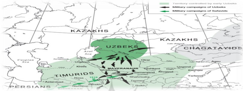
خاستگاه ازبکان (Abazov, 2008: 80)

نمودی از این موفقیت‌ها ورود ترکان مسلمان قراخانی در قالب اتحادیه قبیله‌ای به این سرزمین، شکل‌گیری رسمی حکومت‌های ترک و جاری شدن سنن سیاسی صحرائشینی بود. به‌طور قطع این تعدد قومیت‌ها و عدم وجود انسجام کافی میان آنها، علاوه بر ایجاد خرده‌فرهنگ‌ها، در تمرکزگریزی سیاسی نیز بسیار تأثیرگذار بود. ۱