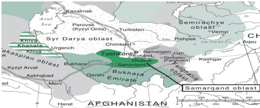
تقسیم‌بندی سیاسی عهد تزاری (Abazov, 2008: 94/m.33)

ب. نکته دوم این بود که مناطق بر جای مانده آسیای مرکزی، یعنی بخارا و خیوه با از دست دادن بسیاری از شهرها و ولایات مهم خود باج‌گزار و تحت‌الحمايه حکومت تزاری شده بودند. روسیه ضمن انتفاع از این شرایط، می‌توانست توجیهی برای آرام ساختن منتقدان نیز فراهم کند و آن استقلال ظاهری این مناطق بود (پیرمشایف، ۱۳۸۸: ۲۰۹). البته به نظر می‌رسد در صورت تداوم حضور روسیه تزاری در منطقه، تحقق تمرکز قدرت و الحاق این دو واحد سیاسی به فرمانداری کل، امر دور از ذهنی نبود. پشتوانه چنین ادعایی، ظهور تدریجی نشانه‌هایی است که همگام با ورود به قرن جدید، از تغییر سیاست روسیه در زمینه استقلال بخارا خبر می‌داد. بی‌شک یکی از مهم‌ترین عوامل در این تغییر مشی، کم‌رنگ شدن «بازی بازگ» ۱ به عنوان مهم‌ترین عامل محرک خارجی بود. منافع مستقیم اقتصادی که روس‌ها از تصرف امارت می‌توانستند داشته باشند، به تدریج در طول این سالها عیان شد؛ به همین دلیل در محافل رسمی روسیه بحث‌هایی درباره انحلال امارت در گرفت. توجیه مقامات روس این بود که در امارت وضع بسیار نامطلوبی حاکم است که برای رهایی از آن ناگزیر باید به جای نظام اداری محلی، ترتیبات روسیه را جاری کرد و امیر فقط به عنوان نماینده منصوب شود (غفوروف، همان، ۱۰۹۹). در سال ۱۹۱۵/م ۱۳۳۳ق. دولت روسیه عملاً تصمیم به انحلال خانات خیوه و بخارا و