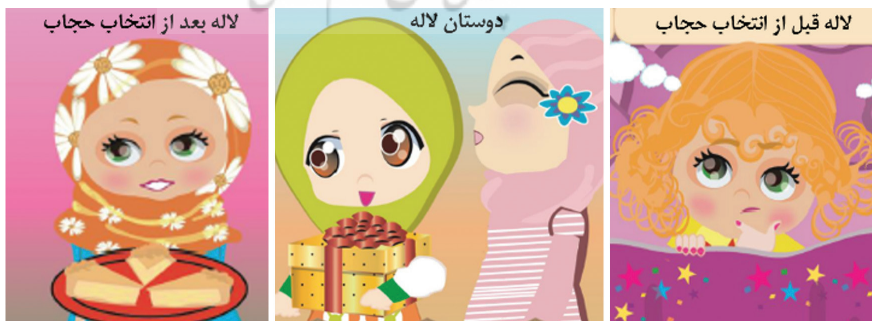
شکل ۲. معرفی شخصیت‌های داستان منظوم پای سیب

● خلاصه داستان: لاله دختری حدوداً ۹ ساله است که تمایلی به رعایت حجاب ندارد. دوستان وی روناک و محدثه، سعی دارند که با اهدای هدیه، ارائه دلیل و روش‌های ایجابی، وی را به حجاب دعوت کنند؛ اما لاله در مقابل دعوت و استدلال دوستانش، واکنش منفی نشان می‌دهد و چند روزی را از آن‌ها فاصله می‌گیرد. طی این چند روز، اتفاقاتی نظیر مشاهده تفاوت بارز رفتار فروشنده‌ای آقا، نسبت به خود و دختری محجبه و تفکری عمیق بعد از جدال درونی خویش، نظر خود را نسبت به حجاب تغییر می‌دهد و برای آشتی با دوستانش، برای آن‌ها کیک پای سیب می‌برد. در این کتاب پنج راهبرد برای پذیرش حجاب از سوی مخاطبان ارائه شد. (الف) نوعی استدلال عقلانی (اقناع) ناظر بر اذیت نشدن و ایجاد مزاحمت در اثر بدحجابی؛ (ب) استدلال نقلی ناظر بر ضرورت پذیرش امر پروردگار به‌عنوان واجب شرعی؛ (پ) درک پیامدهای بی‌حجابی از طریق یادگیری مشاهده‌ای و عاقبت‌اندیشی؛ (ت) تأثیر گذاری عاطفی از طریق صحبت برای تغییر رفتار (هدیه دادن) و (ث) تقویت اراده ورزی و ارائه تصویر پیروزی عقل، بر نفس اماره توسط نویسنده داستان.