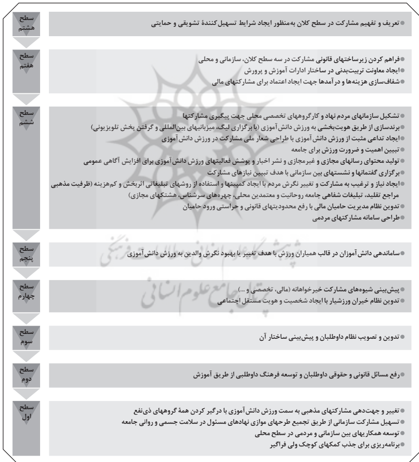
شکل ۲. تعیین سطح متغیرها