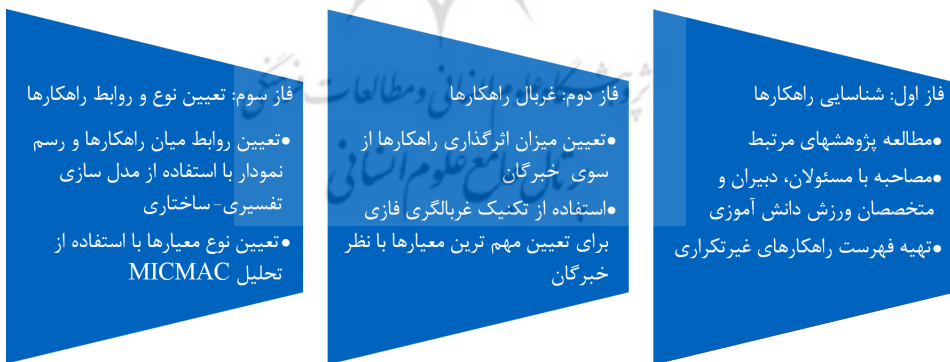
شکل ۱. روش پژوهش